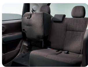
6:4分割可倒式リヤシート (リクライニング、 クッションチップアップ機構付) ●2WD 車のみ