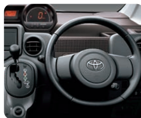
本革巻きステアリングホイール& シフトレバーノブ