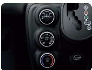
マニュアルエアコン&ダイヤル式 ヒーターコントロールパネル (メッキリング付)