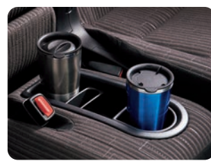
ベンチシートクッショントレイ (カップホルダー付)