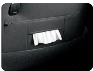
運転席シートバック ティッシュポケット&買い物フック