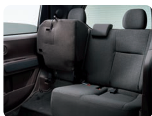
6:4分割可倒式リヤシート (リクライニング、 クッションチップアップ機構付) ●2WD 車のみ