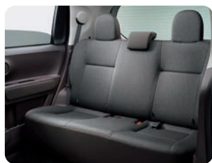
一体可倒式リヤシート ●2WD 車のみ