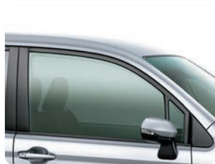
スーパーUVカット+ IR(赤外線)カット機能付ガラス (フロントドア)