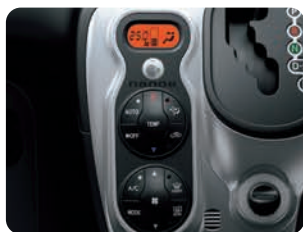
オートエアコン(花粉除去モード付)& プッシュ式ヒーターコントロールパネル& 「ナノイー」