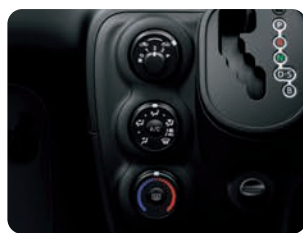
マニュアルエアコン& ダイヤル式ヒーターコントロールパネル