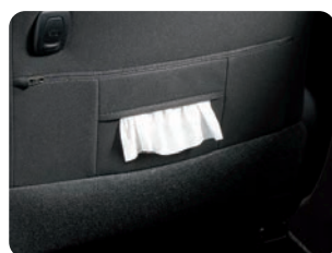
運転席シートバック ティッシュポケット&買い物フック