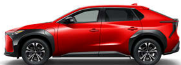
エモーショナルレッドII <3U5>*2