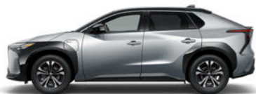
ブラック<202>× プレシャスシルバー<1J6> [2MR]*4