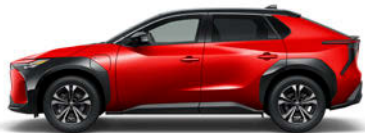
ブラック<202>× エモーショナルレッドII <3U5> [2TB]*4