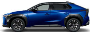
ブラック<202>× ダークブルーマイカ<8S6> [2MT]*2