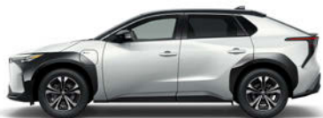
ブラック<202>× プラチナホワイトパールマイカ<089> [2VP]*3