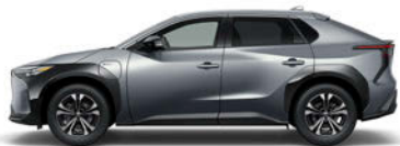
プレシャスメタル<1L5>*2