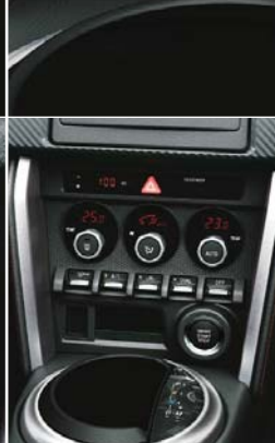
左右独立温度 コントロール フルオートエアコン (ピアノタッチスイッチ+ ダイヤル式)