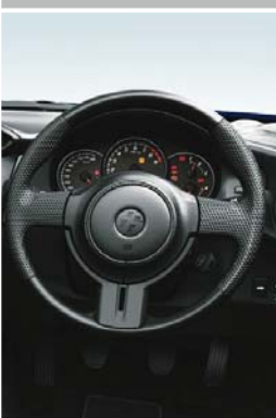
ウレタン ステアリングホイール