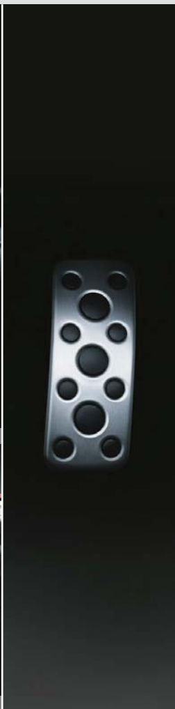
スポーツアルミペダル