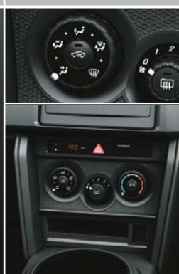
マニュアルエアコン (ダイヤル式)