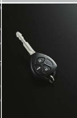
ワイヤレスドアロック リモートコントロール+ 盗難防止システム