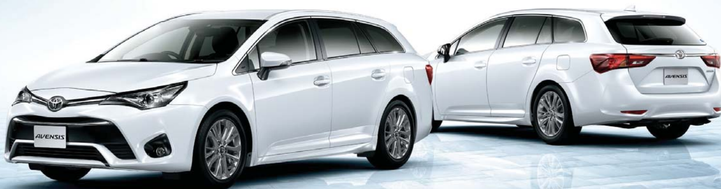
Photo: Li。ボディカラーはスーパーホワイトII(040)。内装色はテラコッタ。オーディオレスカバー<1,296円(取付費が別途必要)>は販売店装着オプション。