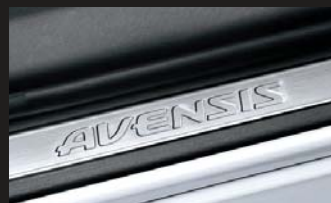
車名ロゴ入りドアスカッフプレート (シルバー加飾)