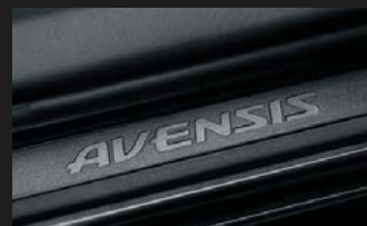
車名ロゴ入りドアスカッフプレート (ブラック)