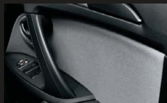
ファブリックドアトリム