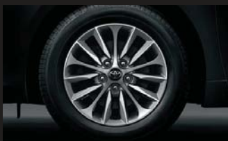
205/60R16タイヤ & 6½Jアルミホイール(オーナメント付)