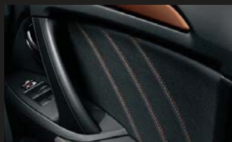
合皮&ダブルステッチドアトリム