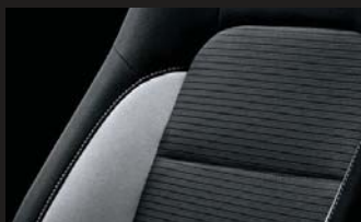
アルカンターラ®+ファブリック シート表皮