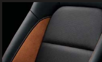
アルカンターラ®+本革 シート表皮