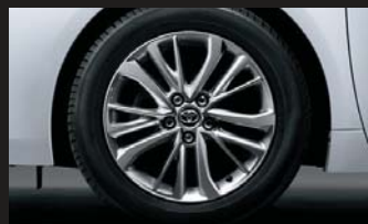
215/55R17タイヤ & 7Jアルミホイール(オーナメント付)