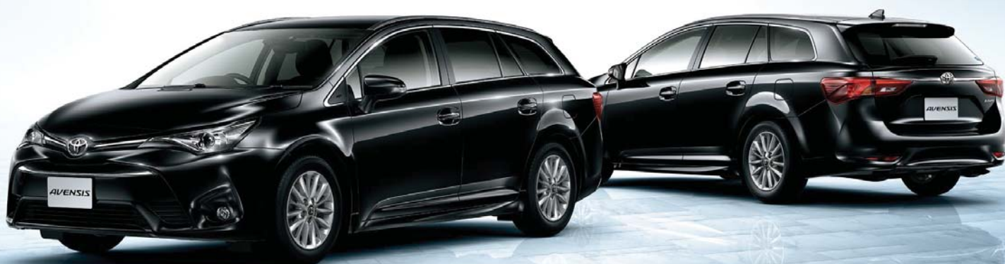
Photo:Xi。ボディカラーはブラックマイカ(209)。内装色はグレー。オーディオレスカバー<1,296円(取付費が別途必要)>は販売店装着オプション。