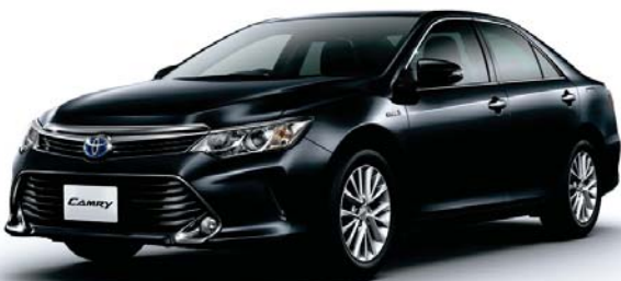
アティチュードブラックマイカ<218>