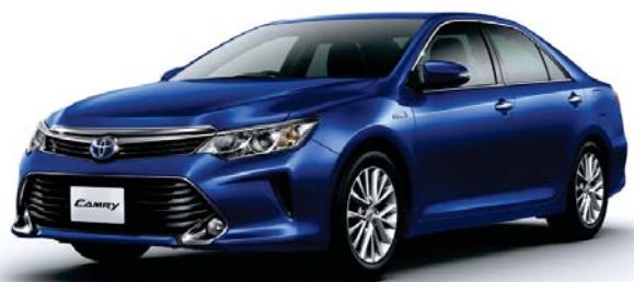
ダークブルーマイカメタリック<8W7>