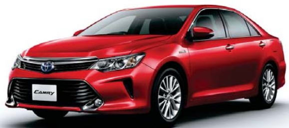
レッドマイカメタリック<3R3>