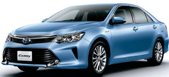
トゥルーブルーマイカメタリック<8W1>