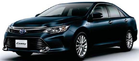
ダークスチールマイカ<1H2>