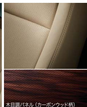
木目調パネル (カーボンウッド柄)