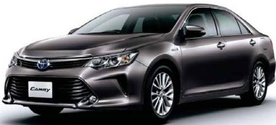
グレイマイカメタリック<1H1>