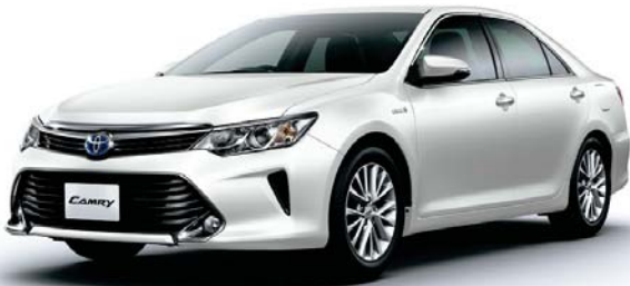
ホワイトパールクリスタルシャイン<070> [メーカーオプション]