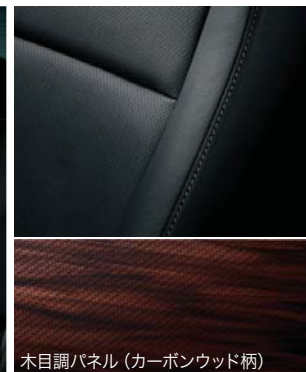
木目調パネル (カーボンウッド柄)