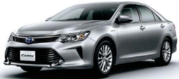
シルバーメタリック<1F7>