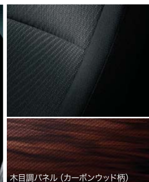
木目調パネル (カーボンウッド柄)