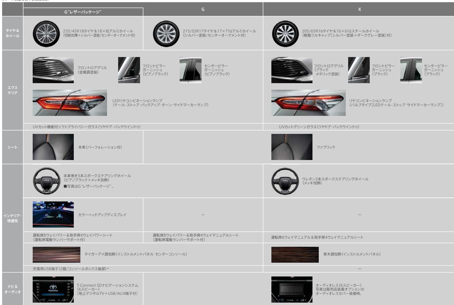
グレード別主な標準装備比較表