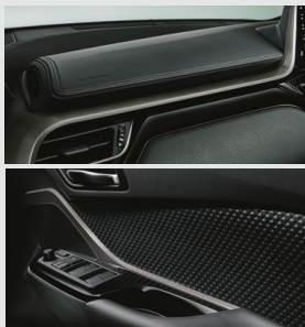
■インストールメントパネル加飾 & ドアインナーガーニッシュ (GR専用金属調ダークシルバー塗装)