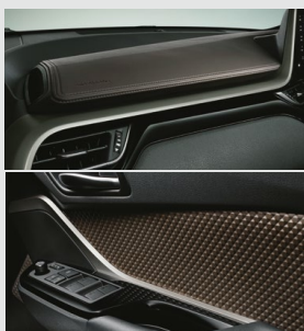
■インストールメントパネル加飾 & ドアインナーガーニッシュ (金属調+ソフト塗装)