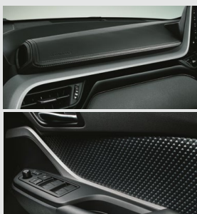
■インストールメントパネル加飾 & ドアインナーガーニッシュ (金属調塗装)