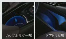
■イルミネーテッドエントリーシステム (フロントカップホルダー・フロントドアトリムアームレスト下部)