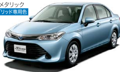
ライトブルーメタリック (8N0) ハイブリッド専用色