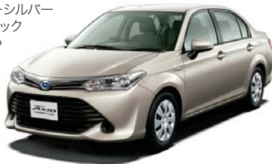
メロースルバー メタリック (1J5)