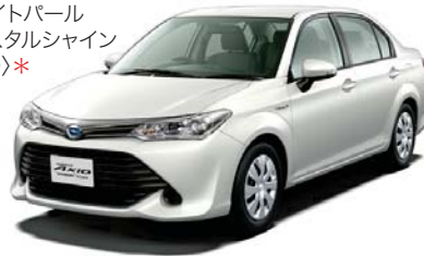
ホワイトパール クリスタルシャイン (070)*