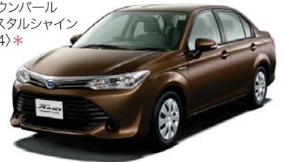
ヴィンテージ ブラウンパール クリスタルシャイン (4X4)*