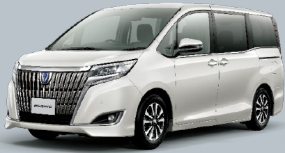
ホワイトパールクリスタルシャイン<070> メーカーオプション