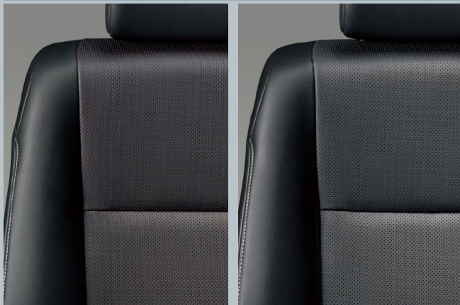
バーガンディ&ブラック