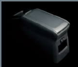
独立型センター コンソールボックス