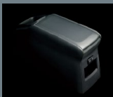
独立型センター コンソールボックス (ハイブリッド専用)