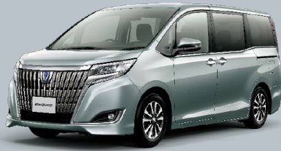
シルバーメタリック<1F7>