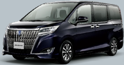
スパークリングブラックパールクリスタルシャイン<220> メーカーオプション