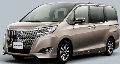
アバンギャルドブロンズメタリック<4V8>