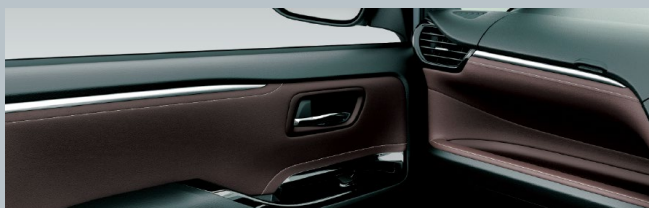
バーガンディ&ブラック