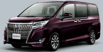
ボルドーマイカメタリック<3R9>