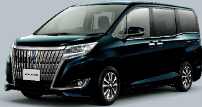
ブラックシ্যাアゲハガラスフレーク<221> メーカーオプション