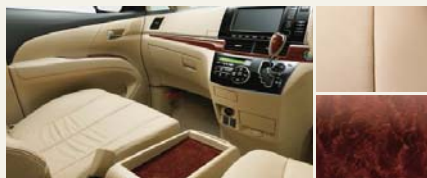
■内装色:シェル ■シート表皮:本革*2*3 ■インテリアパネル:バーズアイ木目調 (サテン調シルバー加飾モール付)