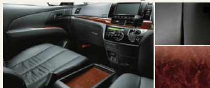
■内装色:ブラック ■シート表皮:本革*2 ■インテリアパネル:バーズアイ木目調 (サテン調シルバー加飾モール付)