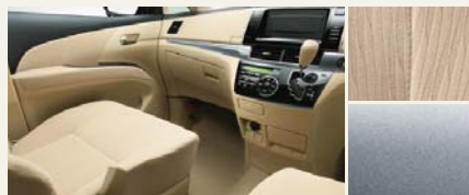
■内装色:シェル ■シート表皮:トリコット ■インテリアパネル:シルバー塗装 (サテン調シルバー加飾モール付)