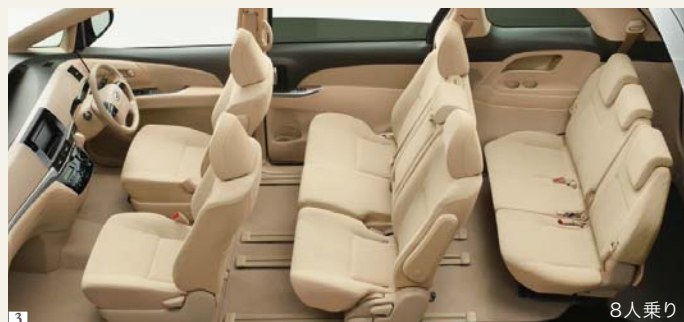
Photo(1・2・3):X(2.4L・8人乗り)2WD。ボディカラーはシルバーメタリック(1F7)。内装色はシェル。オーディオレスカパー<1,296円(取付費が別途必要)>は販売店装着オプション。