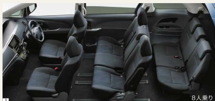
Photo(1・2・3):アエラス(2.4L・8人乗り)2WD。ボディカラーはグレイッシュブルーマイカメタリック(8V5)。内装色はブラック。オーディオレスカー<1,296円(取付費が別途必要)>は販売店装着オプション。