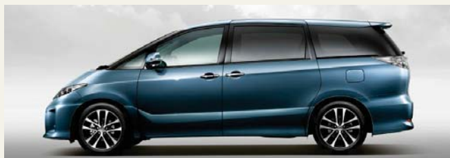
グレイッシュブルーマイカメタリック(8V5)