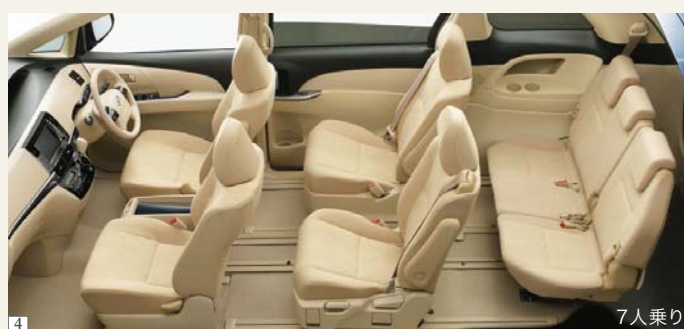
Photo(4):アエラス(3.5L・7人乗り)2WD。内装色のシェルは設定色(ご注文時に指定が必要です。指定がない場合にはブラックになります)。盗難防止システム(イモビライザー+オートアラーム)、G-BOOK mX Pro専用DCMはセット<68,040円>でメーカーオプション。HDDナビゲーションシステム&エスティマ・パノラミックライブサウンドシステム+音声ガイダンス機能付カラーバックガイドモニター<386,640円>はメーカーオプション。