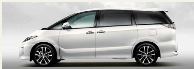
ホワイトパールクリスタルシャイン(070)*1