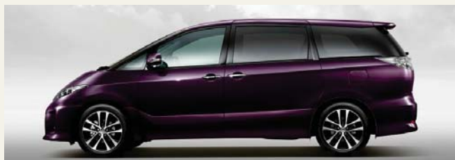
ボルドーマイカメタリック(3R9)