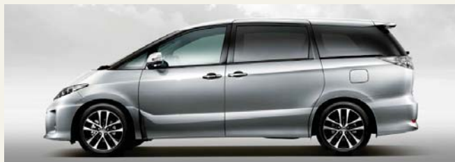
シルバーメタリック(1F7)