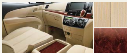
■内装色:シェル ■シート表皮:ジャカード織物 ■インテリアパネル:バーズアイ木目調 (サテン調シルバー加飾モール付)