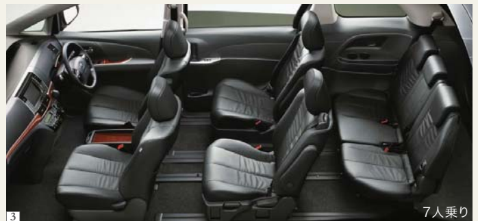
Photo(1・2・3):アエラス“レザーパッケージ”(3.5L・7人乗り)2WD。ボディカラーはアイステクニウムマイカメタリック(1H4)。内装色はブラック。 HDDナビゲーションシステム&エスティマ・パノラミックスーパーライブサウンドシステム+音声ガイダンス機能付カラーバックガイドモニター<555,120円>、パワーバックドア<59,400円>、SRSサイドエアバッグ&SRSニーエアバッグ&SRSカーテンシールドエアバッグ<81,000円>はメーカーオプション。