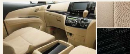
■内装色:シェル【設定あり】 ■シート表皮:アエラス専用トリコット ■インテリアパネル:アエラス専用加飾 (サテン調シルバー加飾モール付)