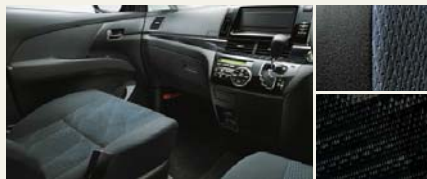
■内装色:ブラック ■シート表皮:アエラス専用トリコット ■インテリアパネル:アエラス専用加飾 (サテン調シルバー加飾モール付)