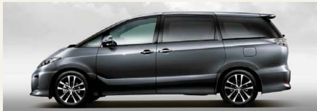
アイスチタニウムマイカメタリック(1H4)