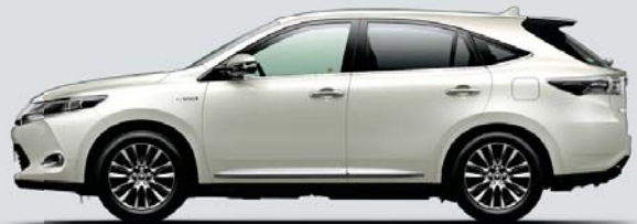
ホワイトパールクリスタルシャイン*1<070>