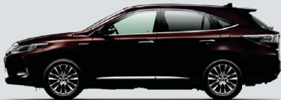
ブラッキッシュレッドマイカ<3R0>