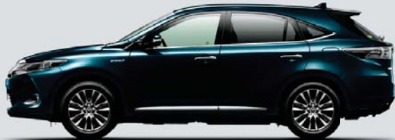
ブラッキッシュアゲハガラスフレーク*1<221>