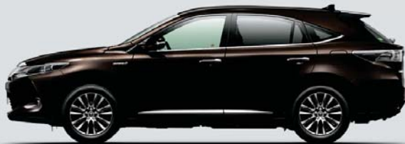
ダークブラウンメタリック<4U5>

■写真はすべてPREMIUM "Advanced Package" (ハイブリッド車)。