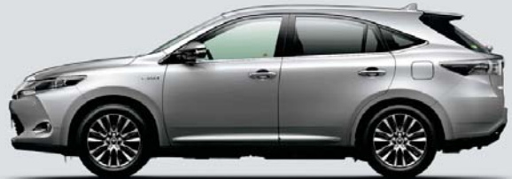
シルバーメタリック<1F7>