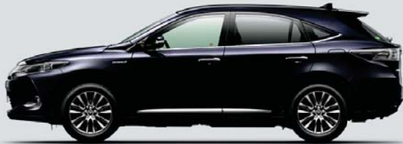
スパークリングブラックパールクリスタルシャイン*1<220>