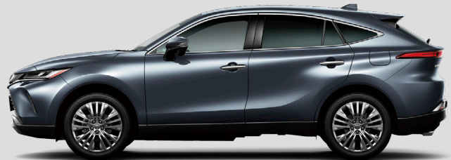
スレートグレーメタリック<1K9>