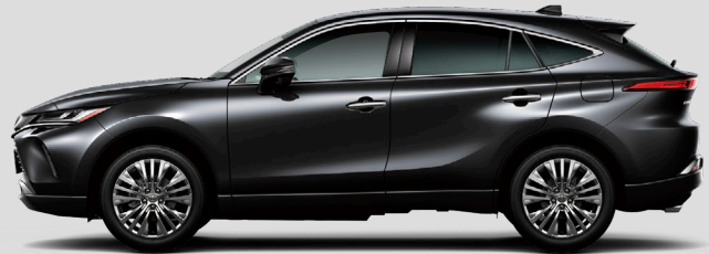
プレシャスブラックパール<219>*1