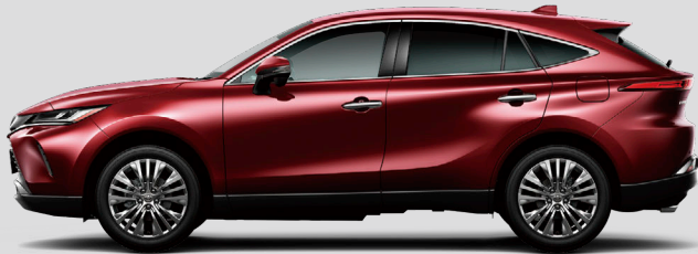
センシユアルレッドマイカ<3T3>*1*2