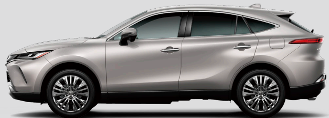
スティールプロンドメタリック<4X1>*2