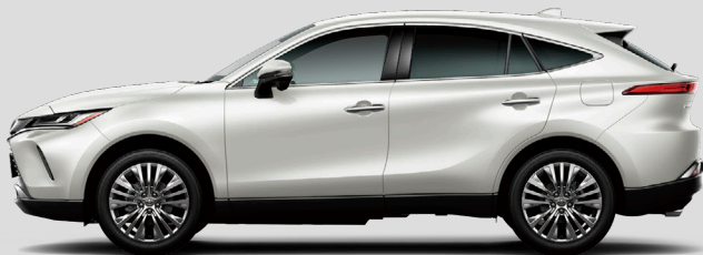
ホワイトパールクリスタルシャイン<070>*1*2