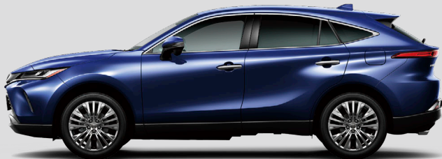
ダークブルーマイカ<8X8>