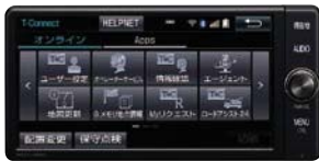
T-Connectナビ (販売店装着オプション)