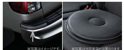
バンパープロテクター

■詳しくは別冊のACCESSORIES & CUSTOMIZE CATALOGUEをご覧ください。