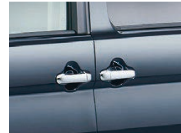
アウトサイドドアハンドル (メッキ)