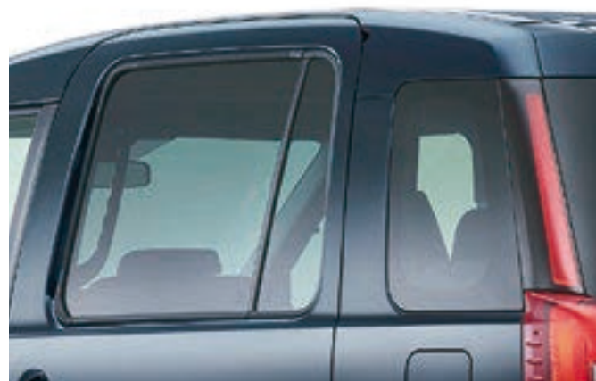
リヤドアプライバシーガラス (スーパーUVカット機能・IRカット機能付/遮音性ガラス) リヤクォータープライバシーガラス (UVカット機能付/厚板ガラス)