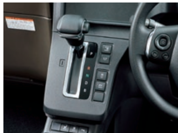
シフトレバー&ノブ (サテンメッキ加飾)