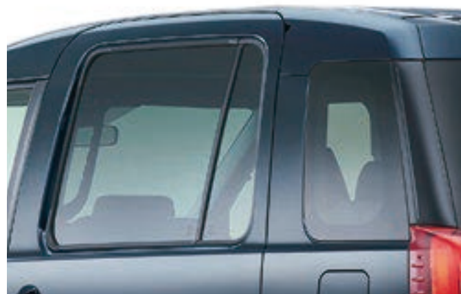
リヤドアプライバシーガラス (スーパーUVカット機能付) リヤクォータープライバシーガラス (UVカット機能付)