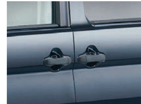
アウトサイドドアハンドル (素地)