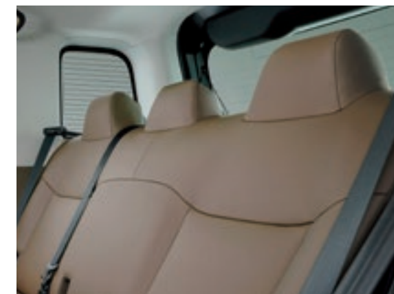
抗菌仕様合成皮革シート表皮