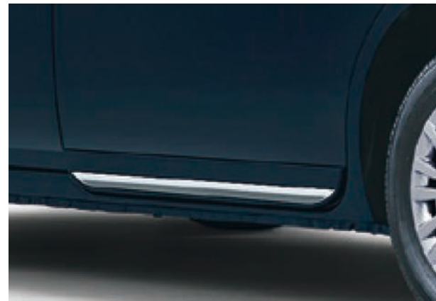
リヤ左側サイドプロテクションモール (ボディ色+メッキ)