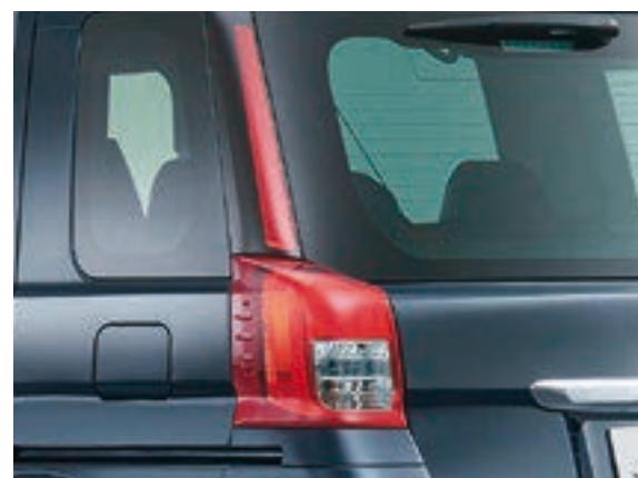
リヤコンビネーションランプ（リヤランプ付）