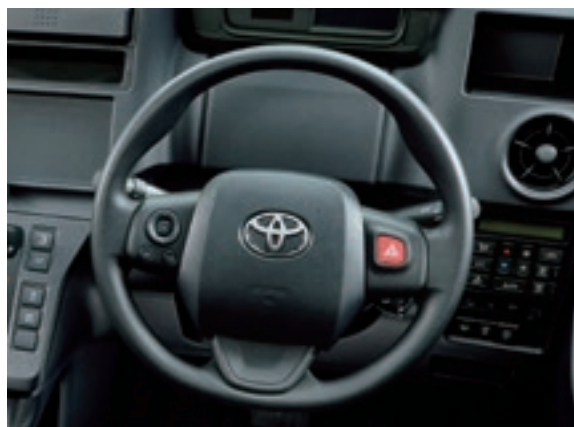
ウレタン3本スポークステアリングホイール (ブラック)