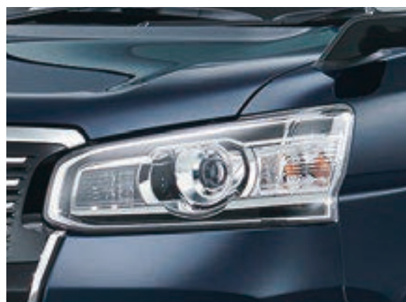
Bi-Beam LEDヘッドランプ（オートレベリング機能付） +LEDクリアランスランプ+LEDデイライト