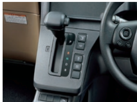
シフトレバー&ノブ (ブラック)