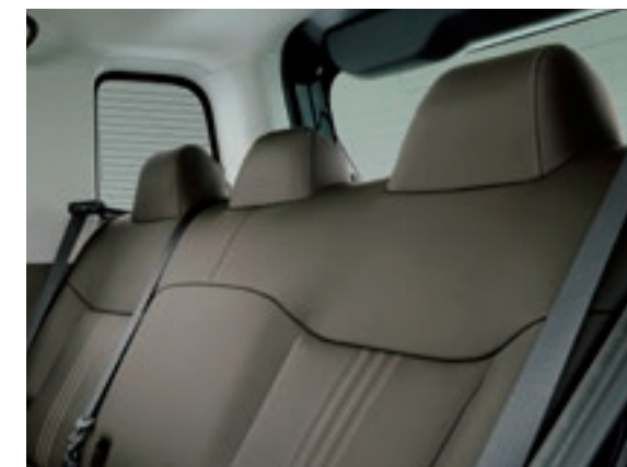
抗菌仕様合成皮革シート表皮 (ステッチ付)