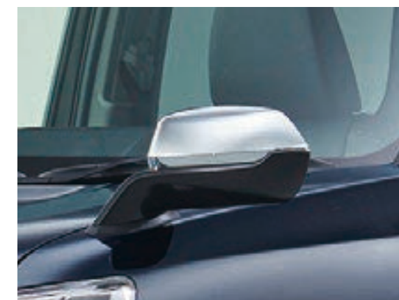
電動リモコンフェンダーミラー（メッキ）