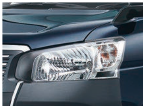
ハロゲンヘッドランプ（マニュアルレベリング機能付） +クリアランスランプ