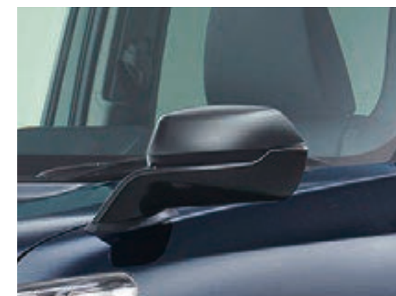
電動リモコンフェンダーミラー（素地）