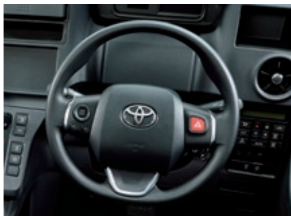
ウレタン3本スポークステアリングホイール (サテンメッキ加飾)