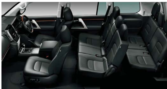
Photo:AX“Gセレクション”。ボディカラーはアティチュードブラックマイカ(218)。内装色はブラック。ルーフレール<32,400円>はメーカーオプション。