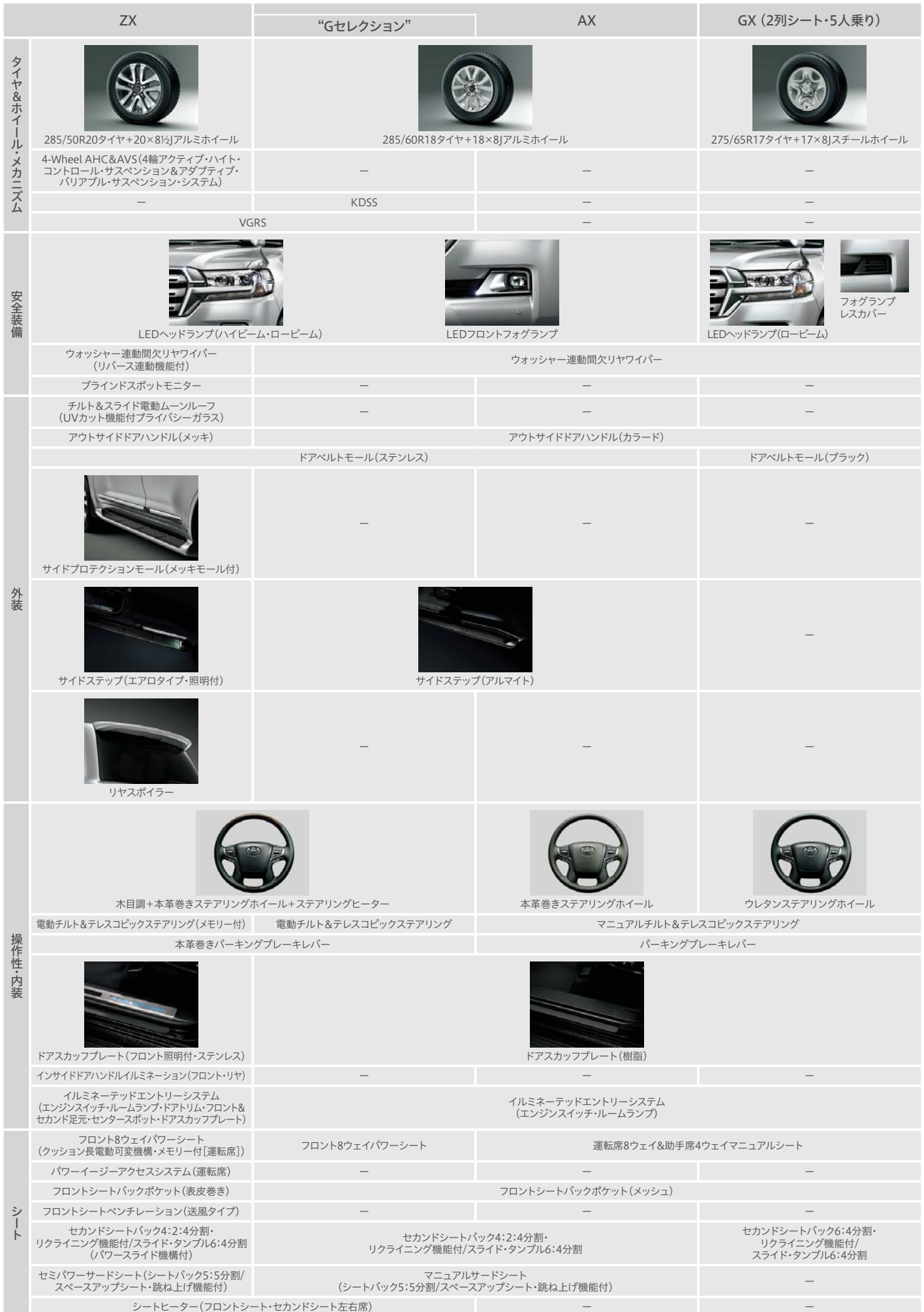
グレード別主な標準装備比較表

■装備類の詳細い設定につきましては、P.46～P.47の主要装備一覧表をご覧ください。