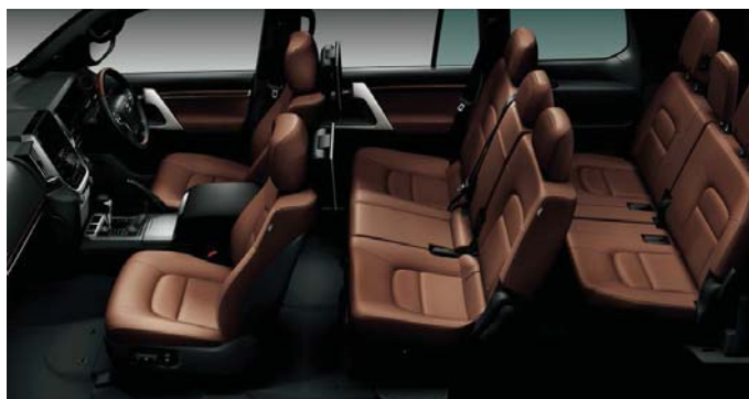
Photo:ZX。ボディカラーのホワイトパールクリスタルシャイン(070)<32,400円>はメーカーオプション。内装色はブラウン。ルーフ色のブラックは設定色(ご注文時に指定が必要です。指定がない場合はグレーになります)。タイヤ空気圧警報システム(21,600円)、ヘッドランプクリーナー<10,800円>、パワーバックドア<108,000円>、リヤシートエンターテインメントシステム<147,960円>はメーカーオプション。T-Connect SDナビゲーションシステム&トヨタプレミアムサウンドシステム、マルチテレンモニター、リヤクロストラフィックアラート、リモートセキュリティシステムはセット<773,280円>でメーカーオプション。※マルチテレンモニターを装着しているため、補助確認装置(2面鏡式)が非装着となっています。