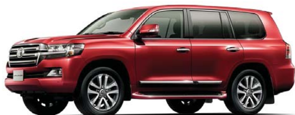
ダークレッドマイカメタリック(3Q3)