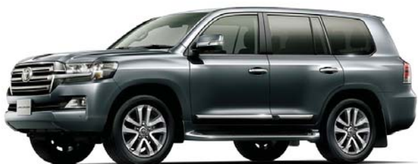
グレーメタリック(1G3)