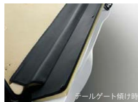
テールゲート傾け時