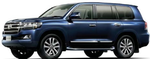
ダークブルーマイカ(8P8)

■ボディカラーの写真はすべてZX、T-Connect SDナビゲーションシステム&トヨタプレミアムサウンドシステム、マルチテレンモニター、リモートセキュリティシステムはセットでメーカーオプション。 ※マルチテレンモニターを装着しているため、補助確認装置(2面鏡式)が非装着となっています。