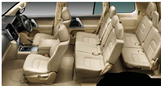
Photo: AX。ボディカラーはカッパーブラウンマイカ(4S6)。内装色のニュートラルベージュは設定色(ご注文時に指定が必要です。指定がない場合はミディアムグレーになります)。寒冷地仕様<22,680円>はメーカーオプション。