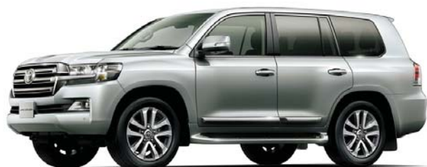
シルバーメタリック(1F7)