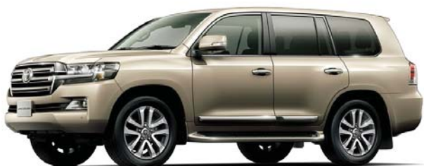
ベージュマイカメタリック(4R3)