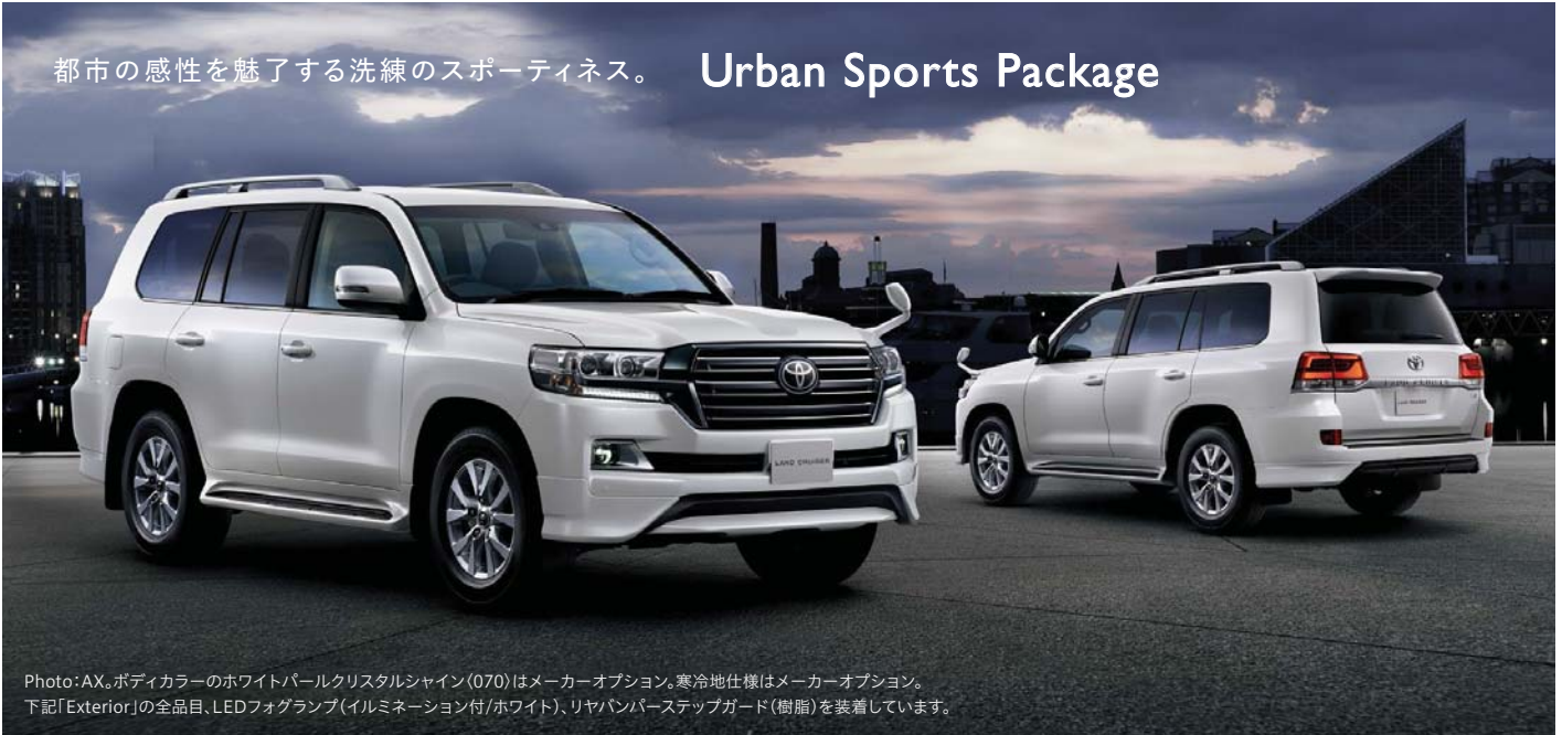
Photo: AX。ボディカラーのホワイトパールクリスタルシャイン(070)はメーカーオプション。寒冷地仕様はメーカーオプション。 下記「Exterior」の全品目、LEDフォグランプ(イルミネーション付/ホワイト)、リヤバンパーステップガード(樹脂)を装着しています。