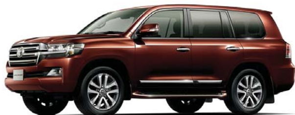
カッパーブラウンマイカ(4S6)