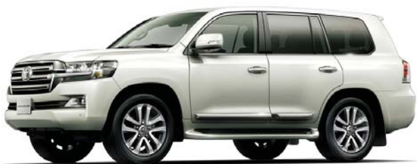
ホワイトパールクリスタルシャイン(070) [メーカーオプション]