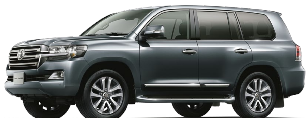
グレーメタリック(1G3)