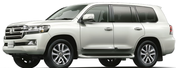
ホワイトパールクリスタルシャイン(070) [メーカーオプション]