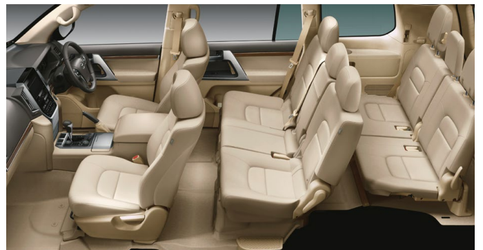
Photo: AX。ボディカラーはダークレッドマイカメタリック(3Q3)。内装色のニュートラルベージュは設定色(ご注文時に指定が必要です。指定がない場合はミディアムグレーになります)。寒冷地仕様<23,100円>はメーカーオプション。