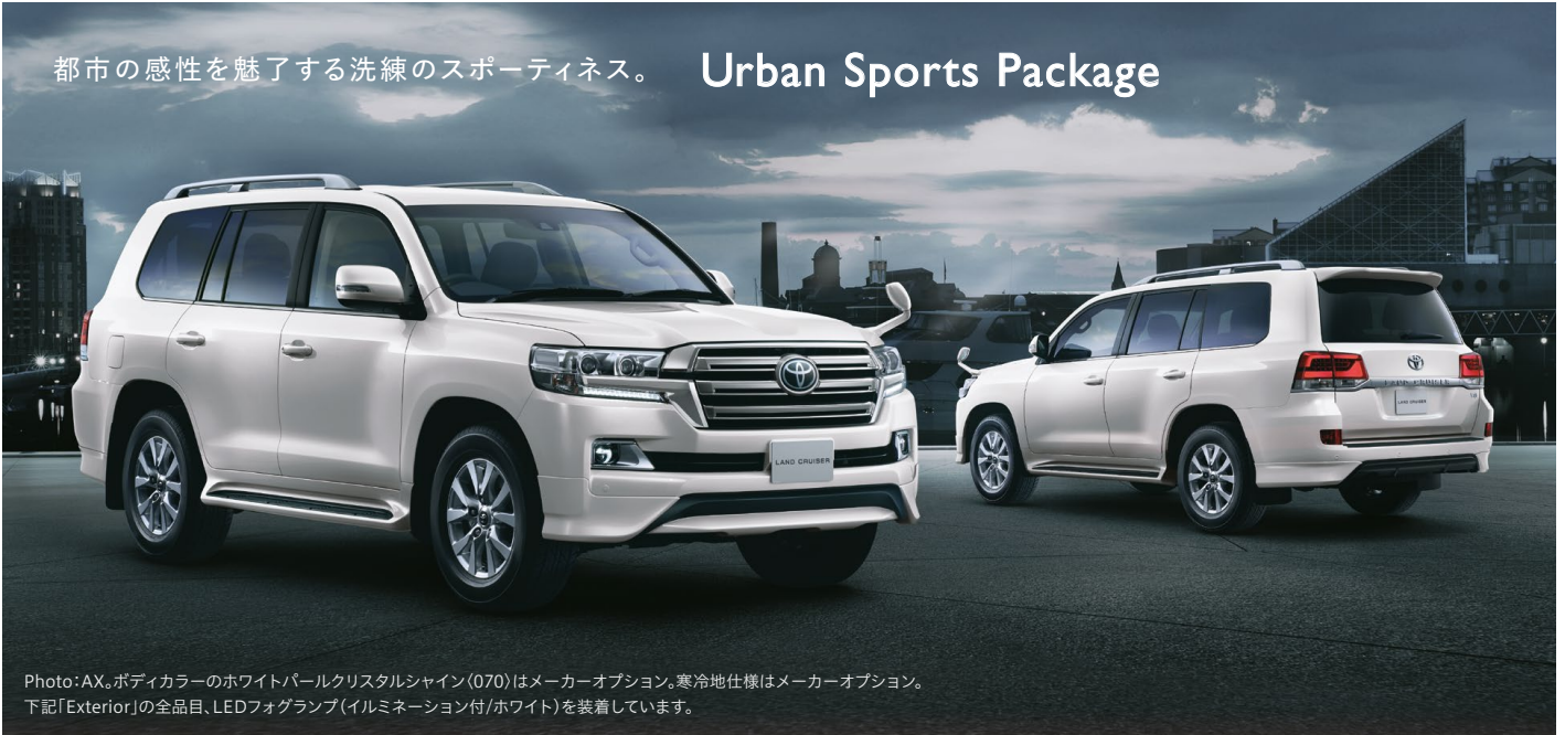
Photo: AX。ボディカラーのホワイトパールクリスタルシャイン(070)はメーカーオプション。寒冷地仕様はメーカーオプション。下記「Exterior」の全品目、LEDフォグランプ(イルミネーション付/ホワイト)を装着しています。