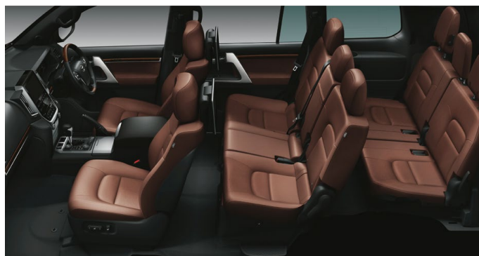
Photo: ZX。ボディカラーのホワイトパールクリスタルシャイン(070)<33,000円>はメーカーオプション。内装色はブラウン。ルーフ色のブラックは設定色(ご注文時に指定が必要です。指定がない場合はグレーになります)。タイヤ空気圧警報システム<22,000円>、ヘッドランプクリーナー<11,000円>、パワーバックドア<110,000円>、リヤシートエンターテインメントシステム<150,700円>はメーカーオプション。T-Connect SDナビゲーションシステム&トヨタプレミアムサウンドシステム、マルチレインモニター、リヤクロストラフィックアラート、リモートセキュリティシステムはセット<787,600円>でメーカーオプション。※マルチレインモニターを装着しているため、補助確認装置(2面鏡式)が非装着となっています。