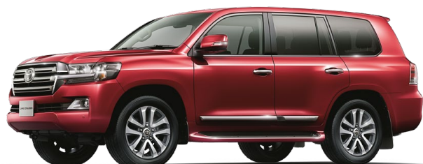
ダークレッドマイカメタリック(3Q3)

■ボディカラーの写真はすべてZX。T-Connect SDナビゲーションシステム&トヨタプレミアムサウンドシステム、マルチテレンモニター、リモートセキュリティシステムはセットでメーカーオプション。 ※マルチテレンモニターを装着しているため、補助確認装置(2面鏡式)が非装着となっています。