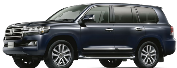
アティチュードブラックマイカ(218)