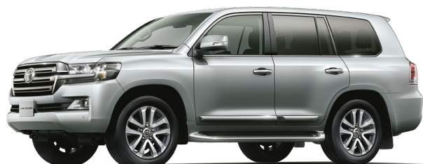
シルバーメタリック(1F7)