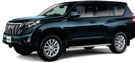
ダークスチールマイカ (1H2)