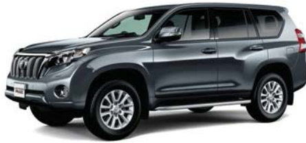
グレーメタリック (1G3)