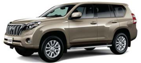
ブロンズマイカメタリック (4T3)