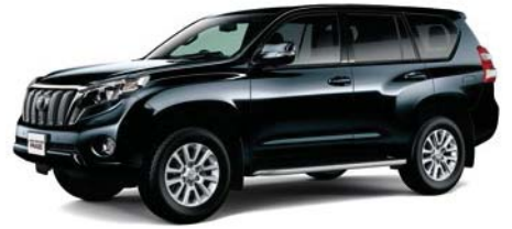
アティチュードブラックマイカ (218)