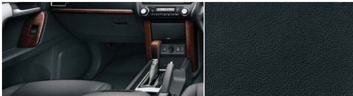
■内装色:ブラック ■シート表皮:本革