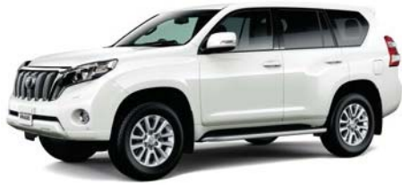
ホワイトパールクリスタルシャイン (070) ※メーカーオプション