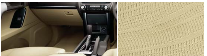
■内装色:フラクセン ■シート表皮:ファブリック(モケット)