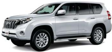
シルバーメタリック (1F7)