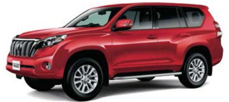
レッドマイカメタリック (3R3)