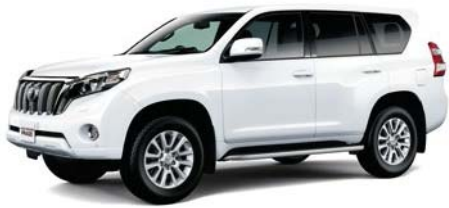
スーパーホワイトII (040)