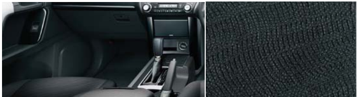
■内装色:ブラック ■シート表皮:ファブリック(モケット)