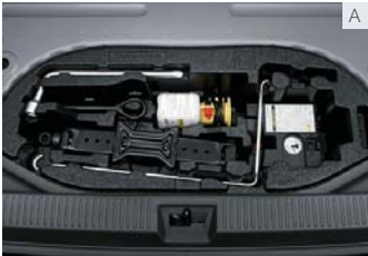
パンク修理キット