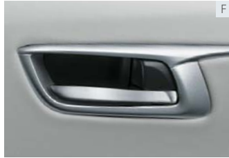
メッキ加飾インサイドドアハンドル