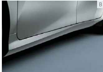
サイドマッドガード(カラード)