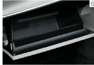
キー付グローブボックス