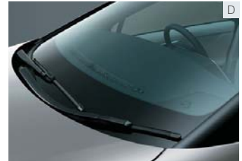
雨滴感知式ウォッシャー連動オートワイパー