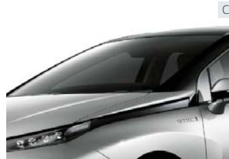
IRカット機能付ウインドシールドガラス (高遮音性ガラス/グリーン合わせ、UVカット機能付)