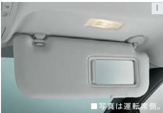
サンバイザー(運転席チケットホルダー、運転席・ 助手席バニティミラー&天井照明付)