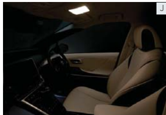
イルミネーテッドエントリーシステム (フロント足元照明+ルームランプ)