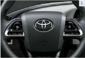
ステアリングスイッチ (ディスプレイ切替く4方向スイッチ・オーディオ・音声認識・ ハンズフリー・車間距離切替・レーンデパーチャーアラート)