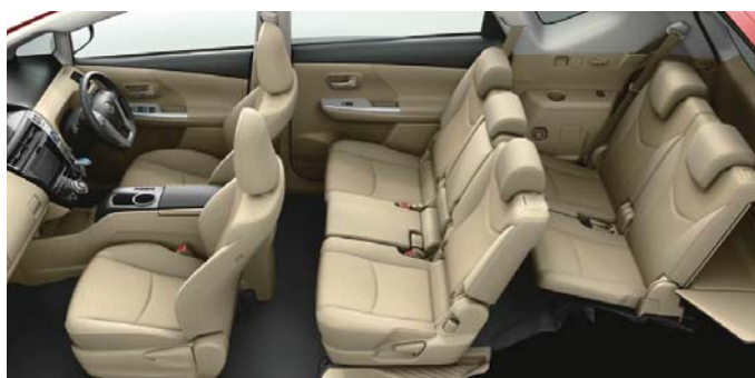
Photo: S “ツーリングセレクション” (7人乗り)。ボディカラーはスーパーレッドV<3P0>。内装色のグレーージュは設定色(ご注文時に指定が必要です。指定がない場合はブラックになります)。オーディオレスカバー<1,296円(取付費が別途必要)>は販売店装着オプション。