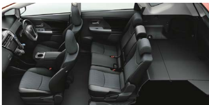
Photo: G “ツーリングセレクション” (5人乗り)。ボディカラーはオレンジメタリック<4R8>。内装色はブラック。オーディオレスカバー<1,296円(取付費が別途必要)>は販売店装着オプション。