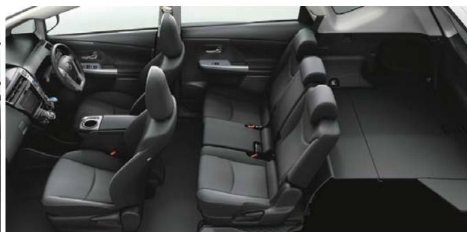
Photo: S“Lセレクション”(5人乗り)。ボディカラーはスーパーホワイトⅡ(040)。内装色はブラック。オーディオレスカバー<1,296円(取付費が別途必要)>は販売店装着オプション。