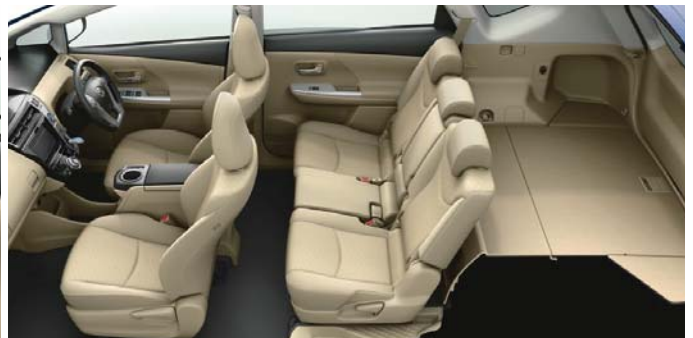
Photo:S(5人乗り)。ボディカラーはダークブルーマイカ<8T5>。 内装色のグレージュは設定色(ご注文時に指定が必要です。指定がない場合はブラックになります)。オーディオレスカバー<1,296円(取付費が別途必要)>は販売店装着オプション。