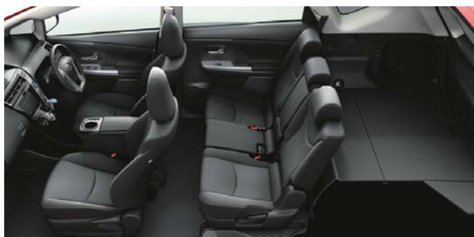
Photo: S “ツーリングセレクション” (5人乗り)。ボディカラーはスーパーレッドV<3P0>。内装色はブラック。オーディオレスカバー<1,296円(取付費が別途必要)>は販売店装着オプション。