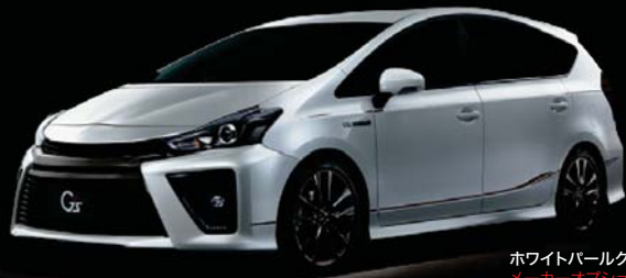
ホワイトパールクリスタルシャイン<070> メーカーオプション