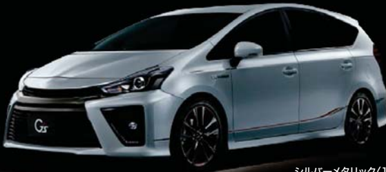
シルバーメタリック<1F7>