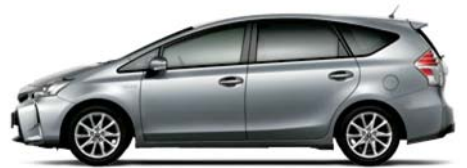
シルバーメタリック〈1F7〉