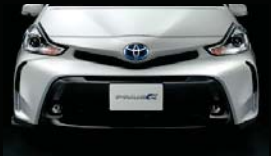
フロントバンパースポイラー