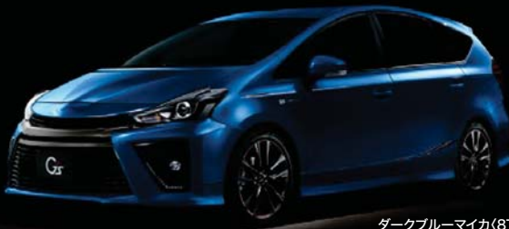
ダークブルーマイカ<8T5>