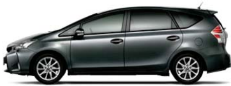
グレーメタリック〈1G3〉