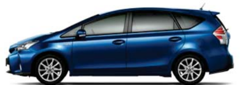
ダークブルーマイカ〈8T5〉