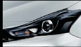
Bi-Beam LEDヘッドランプ (ブラックエクステンション加飾)