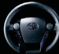
ティンクル本革巻き4本スポークステアリング ホイール(シルバーステッチ)+スイッチベース (ラム入りピアノブラック塗装)