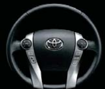
本革巻きステアリングホイール