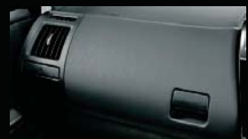
合成皮革インストルメントパネル(助手席側)