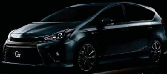
アティチュードブラックマイカ<218>