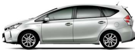
ホワイトパールクリスタルシャイン〈070〉 メーカーオプション