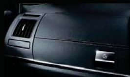
助手席側インストルメントパネル (革シボ調合成皮革+シルバーダブルステッチ+ クロムメッキモール+G'sロゴ付メッキレバー)+ サイドレジスター(革シボ調+クロムメッキモール)