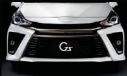
G's専用フロントバンパー&ラジエーターグリル (ダークメッキ加飾+黒艶塗装)