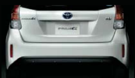
リヤバンパースポイラー