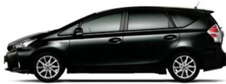
アティチュードブラックマイカ〈218〉