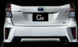
G's専用リヤバンパー (黒艶塗装ガーニッシュ付)