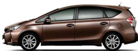
ダークシェリーマイカメタリック〈4W4〉