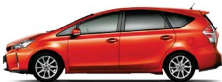
オレンジメタリック〈4R8〉