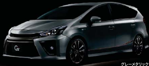
グレーメタリック<1G3>