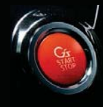
G's専用パワースイッチ(レッド/G'sロゴ付)