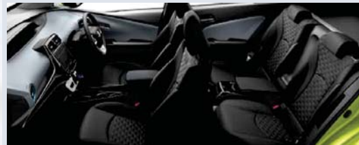
Photo:S.ボディカラーのサーモテクトライムグリーン(6W7)<43,200円>はメーカーオプション。内装色のクールグレーは設定色(ご注文時に指定が必要です。指定がない場合はブラックになります)。 ナビレディセット<27,000円>はメーカーオプション。オーディオレスカバー<1,944円(取付費が別途必要)>は販売店装着オプション。

メーカー希望小売価格*1 3,261,600円 3,020,000円 (消費税抜き)