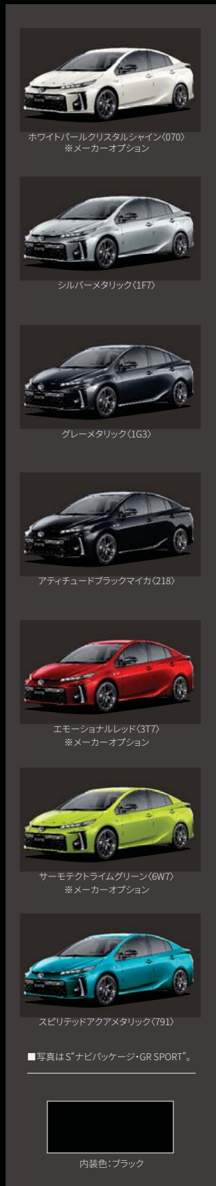
■写真はS"ナビパッケージ・GR SPORT"。 内装色:ブラック

※メーカーオプションとなります。メーカー希望小売価格は、ホワイトパールクリスタルシャイン(070)は32,400円(消費税抜き30,000円)、エモーションレッド(3T7)は54,000円(消費税抜き50,000円)、サマーテクトライムグリーン(6W7)は43,200円(消費税抜き40,000円)となります。 ■ボディカラーは撮影、印刷インキの関係で実際の色とは異なって見えることがあります。