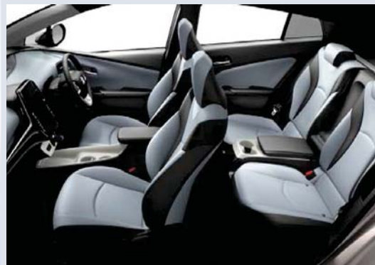
Photo: A“レザーパッケージ”。ボディカラーはスティールブロンドメタリック<4X1>。内装色のクールグレーは設定色(ご注文時に指定が必要です。指定がない場合はブラックになります)。 215/45R17タイヤ&17x7J アルミホイール<72,360円>はメーカーオプション。

メーカー希望小売価格*1 4,066,200円 3,765,000円 (消費税抜き)