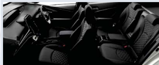
Photo:S“ナビパッケージ”。ボディカラーのホワイトパールクリスタルシャイン(070)<32,400円>はメーカーオプション。内装色はブラック。

メーカー希望小売価格*1 3,666,600円 3,395,000円 (消費税抜き)