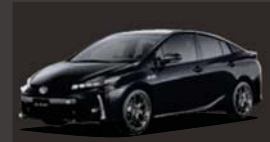
アティチュードブラックマイカ(218)