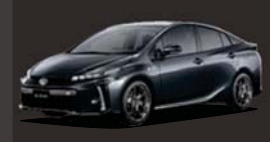
グレーメタリック(1G3)