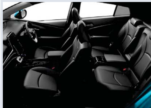
Photo: Aプレミアム。ボディカラーはスピリテッドアクアメタリック<791>。内装色はブラック。 215/45R17タイヤ&17x7J アルミホイール<72,360円>はメーカーオプション。

メーカー希望小売価格*1 4,222,800円 3,910,000円 (消費税抜き)