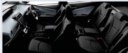
Photo:S。ボディカラーはアティチュードブラックマイカ(218)。内装色のクールグレーは設定色(ご注文時に指定が必要です。指定がない場合はブラックになります)。 ナビレディセット<27,000円>はメーカーオプション。オーディオレスカバー<1,944円(取付費が別途必要)>は販売店装着オプション。

メーカー希望小売価格*1 3,261,600円 3,020,000円 (消費税抜き)