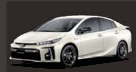
ホワイトパールクリスタルシャイン(070) ※メーカーオプション