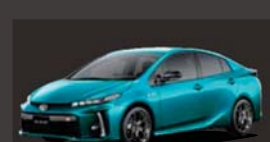
スピリッドアquareタメタリック(791)