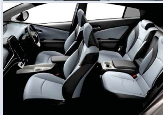
Photo: A“レザーパッケージ”。ボディカラーはスティールブロンズメタリック<4X1>。内装色のクールグレーは設定色(ご注文時に指定が必要です。指定がない場合はブラックになります)。 215/45R17タイヤ&17x7J アルミホイール<72,360円>はメーカーオプション。

メーカー希望小売価格*1 4,066,200円 3,765,000円 (消費税抜き)