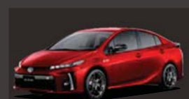
エモーションレッド(3T7) ※メーカーオプション