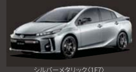
シルバーメタリック(1F7)