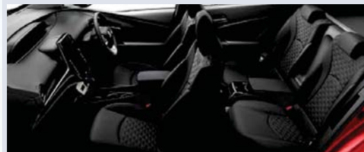
Photo:A。ボディカラーのエモーショナルレッド(3T7)<54,000円>はメーカーオプション。内装色はブラック。 T-Connect SDナビゲーションシステム&JBLプレミアムサウンドシステム<73,440円>はメーカーオプション。

メーカー希望小売価格*1 3,807,000円 3,525,000円 (消費税抜き)