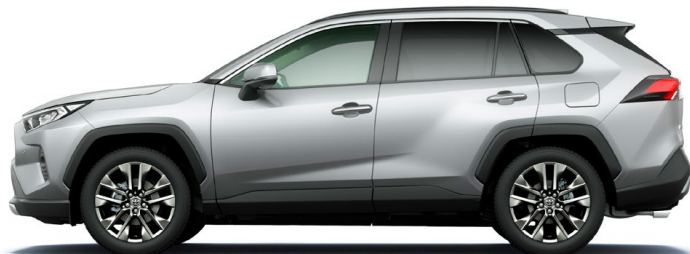
Silver Metallic シルバーメタリック(1D6)*2

G“Z package”/ G / X / HYBRID G / HYBRID X