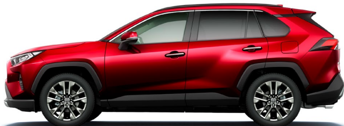
Sensual Red Mica センシュアルレッドマイカ(3T3)*1*2