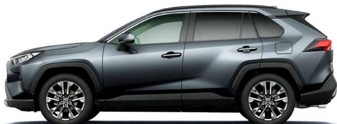
Gray Metallic グレーメタリック(1G3)*2

G"Z package" / G / X / HYBRID G / HYBRID X