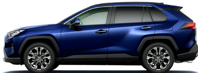
Dark Blue Mica ダークブルーマイカ(8X8)*2

G"Z package" / G / X / HYBRID G / HYBRID X