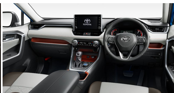
Orchid Brown オーキッドブラウン：設定あり(ご注文時に指定が必要です。指定がない場合はブラックになります)。