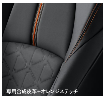
専用合成皮革+オレンジステッチ

■写真はAdventure。 ■快適温熱シート+シートベンチレーションを装着した場合、シート表皮はパーフォレーション付となります。