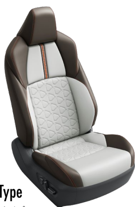
Sporty Type スポーティタイプ

■写真はAdventure。 ■快適温熱シート+シートベンチレーションを装着した場合、シート表皮はパーフォレーション付となります。