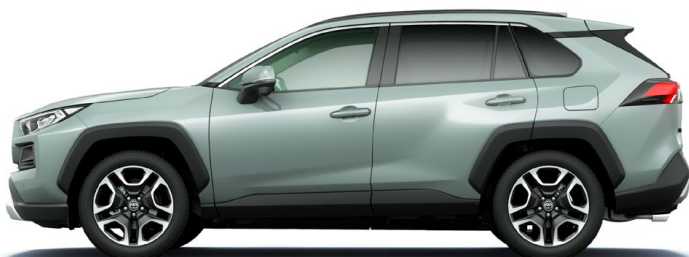
Urban Khaki アーバンカーキ(6X3)*3

G“Z package”/ G / X / HYBRID G / HYBRID X