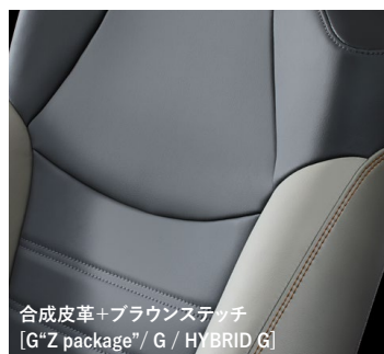
合成皮革+ブラウンステッチ [G“Z package” / G / HYBRID G]

Light Gray ライトグレー：G“Z package”/G/HYBRID Gに設定あり(ご注文時に指定が必要です。指定がない場合はブラックになります)。