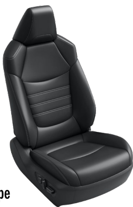
Basic Type ベーシックタイプ

■シート単体(ブラック)、インパネ写真はHYBRID G。 ■オーブントレイ(運転席・助手席・センター)およびフロントカップホルダー部の色は、G“Z package” / G / HYBRID Gがブラウンとなり、X / HYBRID Xがブラックとなります。