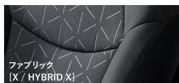
ファブリック [X / HYBRID X]

■シート単体(ブラック)、インパネ写真はHYBRID G。 ■オーブントレイ(運転席・助手席・センター)およびフロントカップホルダー部の色は、G“Z package” / G / HYBRID Gがブラウンとなり、X / HYBRID Xがブラックとなります。