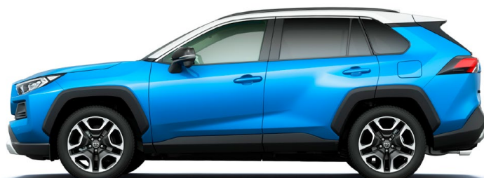
Ash Gray Metallic × Cyan Metallic

アッシュグレーメタリック(1K6)×シアンメタリック(8W9)[2QV]*3*5