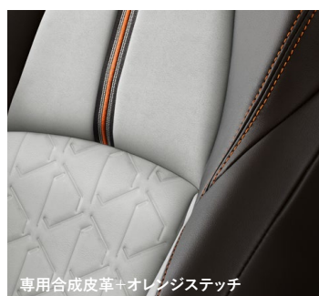
専用合成皮革+オレンジステッチ