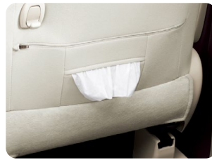
運転席シートバック ティッシュポケット&買い物フック