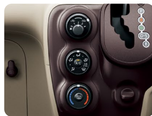
マニュアルエアコン& ダイヤル式ヒーターコントロールパネル