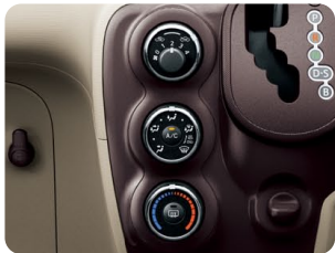
マニュアルエアコン&ダイヤル式 ヒーターコントロールパネル (メッキリング付)