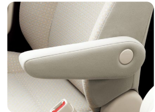
運転席アームレスト

*3. 写真はY。実際のシート表皮は異なります。詳しくはP30~31をご覧ください。