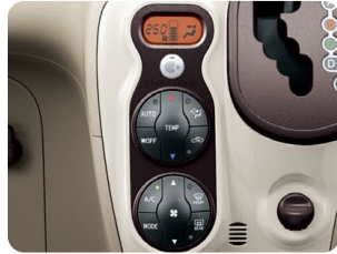
オートエアコン&プッシュ式ヒーター コントロールパネル&「ナノイー」