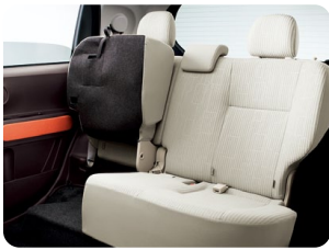
6:4分割可倒式リヤシート (リクライニング、 クッションチップアップ機構付) ●2WD車のみ