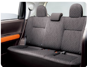
一体可倒式リヤシート