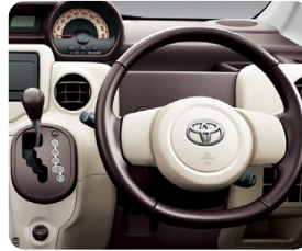
本革巻きステアリングホイール& シフトレバーノブ