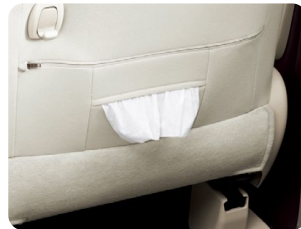
運転席シートバック ティッシュポケット&買い物フック