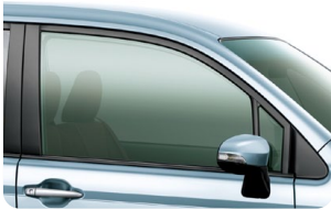
スーパーUVカットガラス (フロントドア)