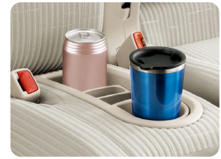
ベンチシートクッショントレイ (カップホルダー付)