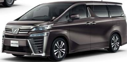
グラファイトメタリック (4X7)

美しさを保つセルフリストアリングコートを採用。 洗車などによる小さなすり傷を自己修復するセルフリストアリングコートを全カラーに採用。分子レベルで結合しやすい特性を備え、新車時の光沢とカラーを長期間にわたり保持することに貢献します。 ※鍵や硬貨などで引っかいた傷のように、セルフリストアリングコートが破壊された場合には、傷は復元しません。傷の復元する時間は、傷の深さや周囲の温度により変化します。なお、お湯をかけるなど、セルフリストアリングコートを暖めることで復元する時間を短くすることができます。耐用年数は5～8年ですが、その後も一般塗装よりも傷がつきにくい状態を保ちます。ワックスをかける場合はコンパウンド(研磨剤)の入っていないものをご使用ください。