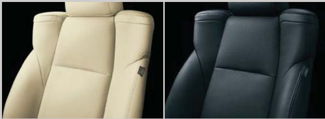
フラクセン ブラック※

本革さながらの高級感を漂わせる上質なマテリアルと、汚れや傷に強い耐久性の高さを兼ね備えた合成皮革です。