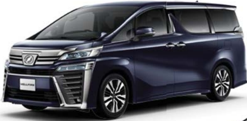
スパークリングブラックパール クリスタルシャイン (220) [エアロタイプ専用色] メーカーオプション