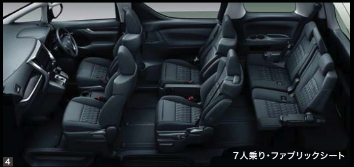
7人乗り・ファブリックシート