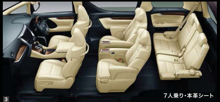
7人乗り・本革シート

Photo (1・2・3) : VL (7人乗り・2WD)。 ボディカラーのパーニングブラッククリスタルシャインガラスフレーク(222)<33,000円>はメーカーオプション。 内装色はフラクセン。オーディオレスカパー+スペーサー<3,520円(取付費が別途必要)>は販売店装着 オプション。 Photo (4) : V (7人乗り・2WD)。 内装色はフラクセン。オーディオレスカパー+スペーサー<3,520円(取付費が別途必要)>は販売店装着 オプション。