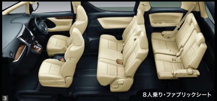
8人乗り・ファブリックシート