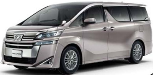
スティールブロンドメタリック (4X1) ■エアロタイプには設定がありません。