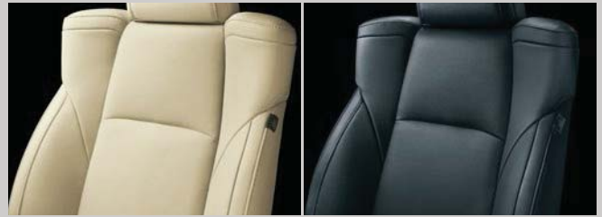
フラクセン ブラック

柔らかさとしなやかさを合わせ持つ、本革の豊かな風合い。全身をやさしく包み込み、この上ないつろぎをもたらします。