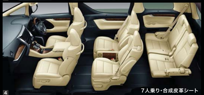
7人乗り・合成皮革シート

Photo (1・2・3) : VL (7人乗り・2WD)。 ボディカラーのパーニングブラッククリスタルシャインガラスフレーク(222)<33,000円>はメーカーオプション。 内装色はフラクセン。オーディオレスカパー+スペーサー<3,520円(取付費が別途必要)>は販売店装着 オプション。 Photo (4) : V (7人乗り・2WD)。 内装色はフラクセン。オーディオレスカパー+スペーサー<3,520円(取付費が別途必要)>は販売店装着 オプション。