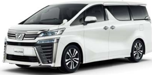
ホワイトパールクリスタルシャイン (070) メーカーオプション