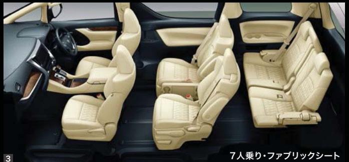
7人乗り・ファブリックシート

Photo (1・2・3) : HYBRID X (7人乗り・E-Four)。 ボディカラーはスチールブロードメタリック(4X1)。 内装色はフラクセン。オーディオレスカパー+スペーサー<3,520円(取付費が別途必要)>は販売店装着オプション。 Photo (4) : HYBRID X (8人乗り・E-Four)。 内装色はフラクセン。オーディオレスカパー+スペーサー<3,520円(取付費が別途必要)>は販売店装着オプション。