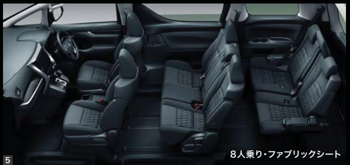
8人乗り・ファブリックシート

Photo (1・2・3) : Z“A エディション” (7人乗り・2WD)。 ボディカラーのホワイトパールクリスタルシャイン (070) <33,000円> はメーカーオプション。 内装色はブラック。オーディオレスカバー+スペーサー <3,520円 (取付費が別途必要)> は販売店装着オプション。