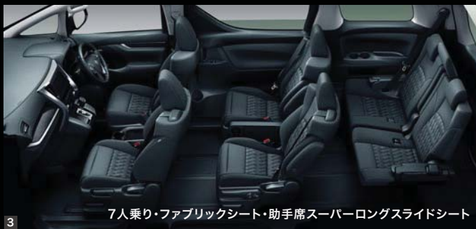
7人乗り・ファブリックシート・助手席スーパーロングスライドシート