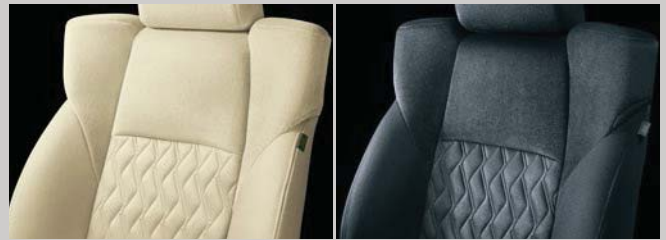
フラクセン ブラック

光沢感があり肌触りのよいファブリック。ラミネーション加工を施すことでキルティングのような立体表現を実現した、高級感あふれるデザインです。