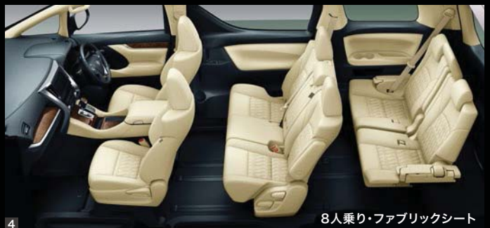
8人乗り・ファブリックシート

Photo (1・2・3) : HYBRID X (7人乗り・E-Four)。 ボディカラーはスチールブロードメタリック(4X1)。 内装色はフラクセン。オーディオレスカパー+スペーサー<3,520円(取付費が別途必要)>は販売店装着オプション。 Photo (4) : HYBRID X (8人乗り・E-Four)。 内装色はフラクセン。オーディオレスカパー+スペーサー<3,520円(取付費が別途必要)>は販売店装着オプション。