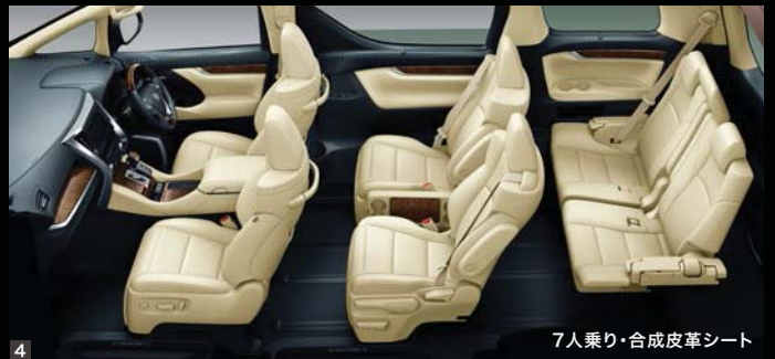
Photo (1・2・3) : HYBRID V“L EDITION” (7人乗り・E-Four)。 ボディカラーはグラファイトメタリック(4X7)。 内装色はフラクセン。オーディオレスカパー+スペーサー<3,520円(取付費が別途必要)>は販売店装着オプション。 Photo (4) : HYBRID V (7人乗り・E-Four)。 内装色はフラクセン。オーディオレスカパー+スペーサー<3,520円(取付費が別途必要)>は販売店装着オプション。