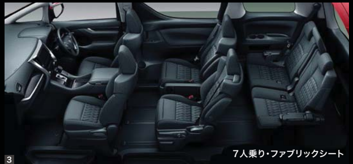
7人乗り・ファブリックシート