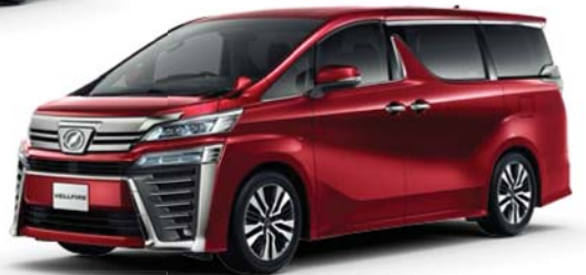
ダークレッドマイカメタリック (3Q3) [エアロタイプ専用色]