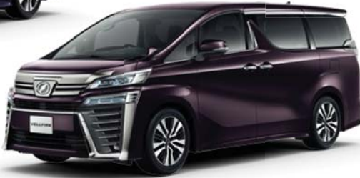
バーニングブラック クリスタルシャイン ガラスブレイク (222) メーカーオプション