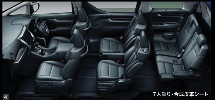
7人乗り・合成皮革シート

Photo(1・2・3) : HYBRID ZR“G EDITION” (7人乗り・E-Four)。 ボディカラーのスパークリングブラックパールクリスタルシャイン(220)<33,000円>はメーカーオプション。 内装色はブラック。オーディオレスカバー+スペーサー<3,520円(取付費が別途必要)>は販売店装着 オプション。 Photo(4) : HYBRID ZR(7人乗り・E-Four)。 内装色はブラック。オーディオレスカバー+スペーサー<3,520円(取付費が別途必要)>は販売店装着 オプション。