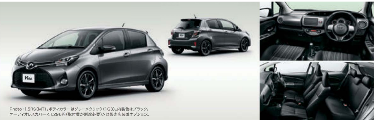
Photo: 1.5RS(MT)。ボディカラーはグレーメタリック(1G3)。内装色はブラック。オーディオレスカバー<1,296円(取付費が別途必要)>は販売店装着オプション。