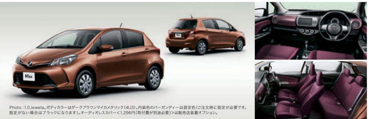
Photo: 1.0Jewela。ボディカラーはダークブラウンマイカメタリック(4U3)。内装色のパーガンティアーは設定色(ご注文時に指定が必要です。指定がない場合はブラックになります)。オーディオレスカバー<1,296円(取付費が別途必要)>は販売店装着オプション。