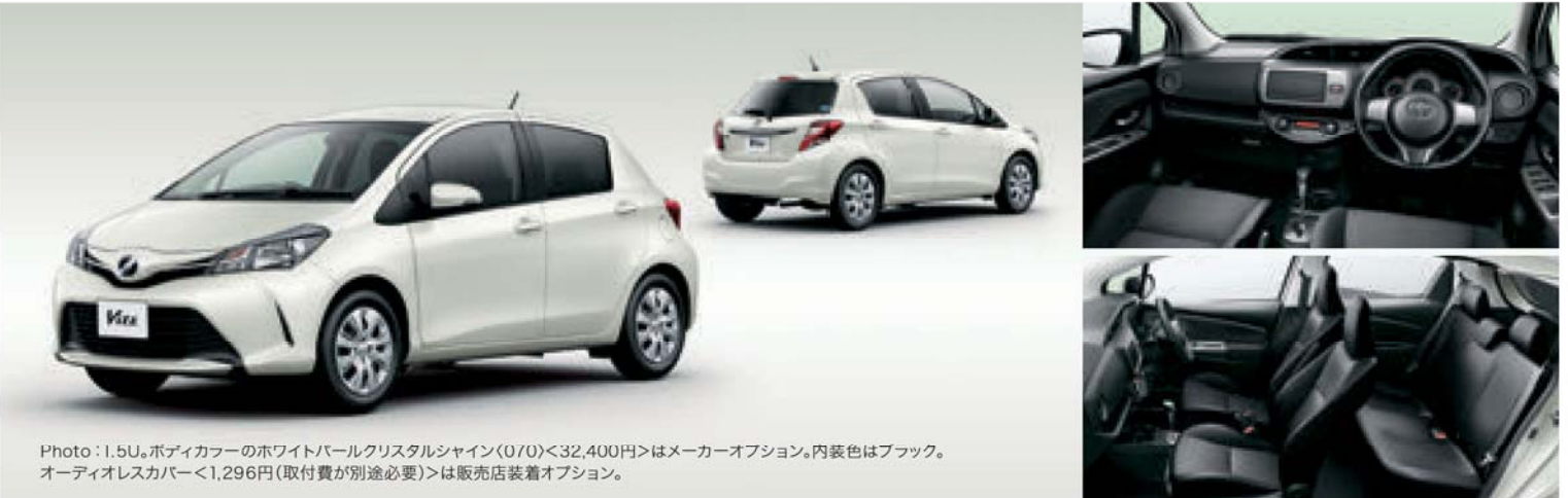
Photo: 1.5U。ボディカラーのホワイトパールクリスタルシャイン(070)<32,400円>はメーカーオプション。内装色はブラック。オーディオレスカバー<1,296円(取付費が別途必要)>は販売店装着オプション。