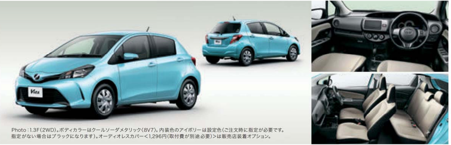
Photo: 1.3F(2WD)。ボディカラーはクールソーダメタリック(8V7)。内装色のアイボリーは設定色(ご注文時に指定が必要です。指定がない場合はブラックになります)。オーディオレスカバー<1,296円(取付費が別途必要)>は販売店装着オプション。