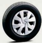
14インチスチールホイール (樹脂フルキャップ付)