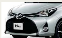
専用スポーツグリル&専用 エアロバンパー(フロント) & フロントフォグラмп