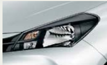
マルチリフレクター ハロゲンヘッドランプ (ブラック)