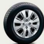
15インチスチールホイール (樹脂フルキャップ付)