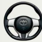
本革巻きステアリングホイール (高輝度シルバー塗装/ ライトグレースタッチ付)