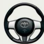
ディンプル本革巻き ステアリングホイール (高輝度シルバー塗装/ ライトグレースタッチ付)