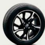
16インチアルミホイール (センターオーナメント付)