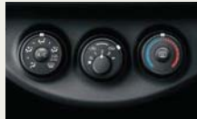
マニュアルエアコン