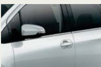
ステンレス製ドアベルト モールディング