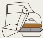
アジャスタブル デッキボード(2WD車)