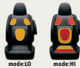
快適温熱シート(運転席) & 運転席アームレスト