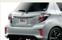
専用エアロバンパー(リヤ) & 専用LED式 リヤコンビネーションランプ