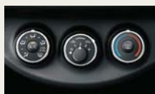
マニュアルエアコン (メッキダイヤル)(1.0L車)