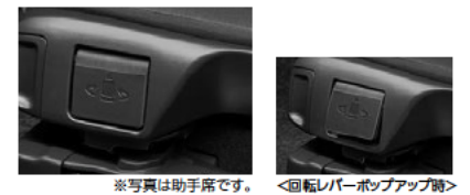
※写真は助手席です。 <回転レバーポップアップ時>