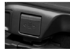
※写真は助手席です。

3 <シートを車内へ戻す場合> 再度回転レバーを引き、回転操作グリップを持って、回転終了位置までシートを回転&チルトします。降車後、回転レバーを引きながら車内へ戻します。