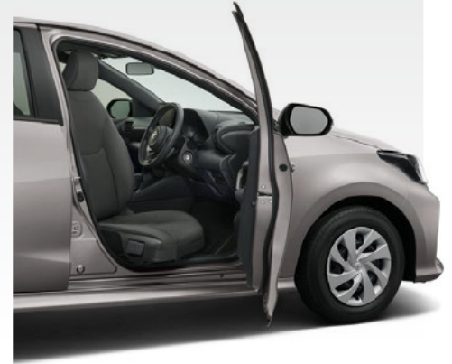
Photo: 1.5X(2WD)車いす収納装置付車“タイプII”。 ボディカラーはアバンギャルドブロンズメタリック(4V8)。 内装色はブラック。