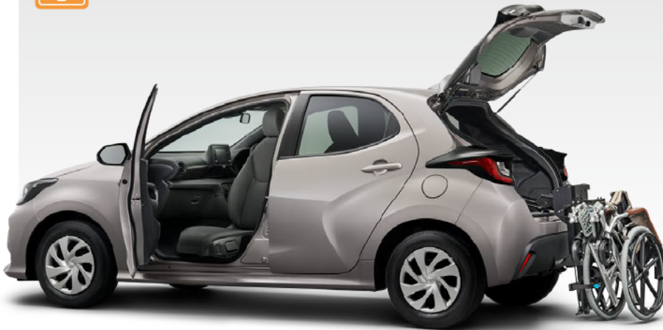
Photo: 1.5X(2WD)車いす収納装置付車“タイプI”。 ボディカラーはアバンギャルドブロンズメタリック(4V8)。 内装色はブラック。※車いすは装備に含まれません。