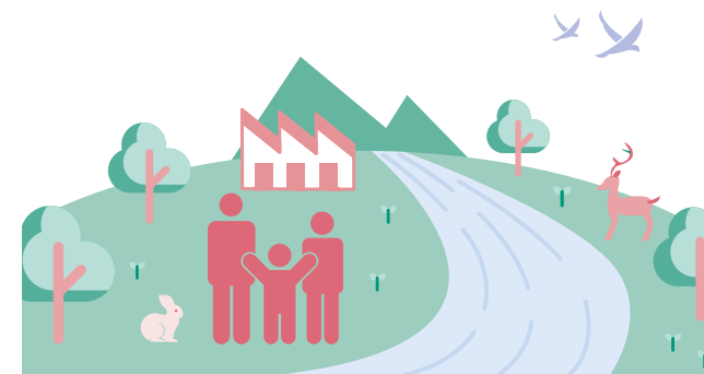
トヨタ カラーラツerring 環境仕様

トヨタは、水使用による環境負荷を小さくするとともに、生物の多様性を取り戻すために、自然保全活動の輪を地域・世界とつなぎ、そして未来へつなぐ活動を進めます。