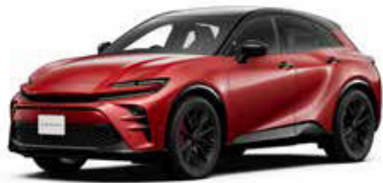
Photo (スタイリング) : SPORT RS (2.5Lプラグインハイブリッド車)。ボディカラーのブラック(227)×エモーションレッドIII(3U9) [2ZR] <99,000円>はメーカーオプション。