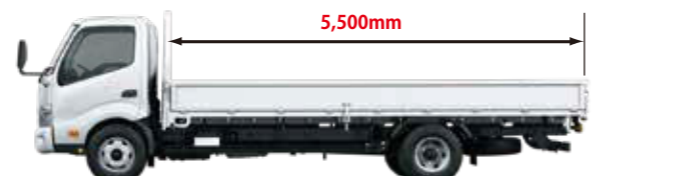
超超ロングデッキ

積荷や使用環境に合わせて選べる豊富なキャブ&デッキタイプを用意。 運転免許制度にも対応したワイドバリエーションで、最適な1台がきっと見つかります。