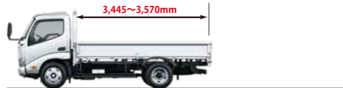
セミロングデッキ