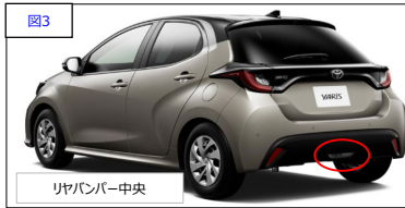
リヤバンパー中央