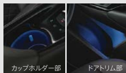
■写真はG ■カップホルダー部