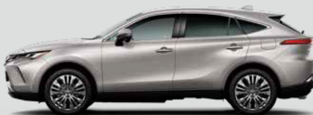
スティールブロンドメタリック<4X1>*2