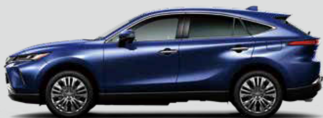
ダークブルーマイカ<8X8>