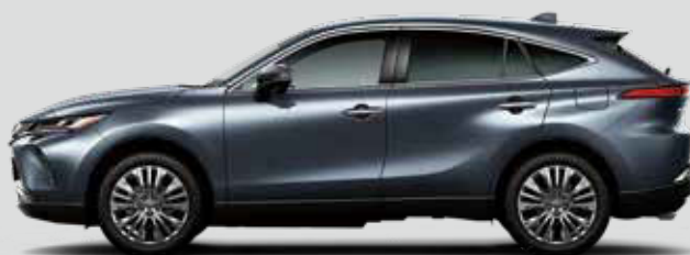
スレートグレーメタリック<1K9>