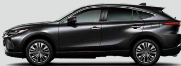
プレシャスブラックパール<219>*1