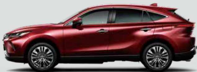
センシュアルレッドマイカ<3T3>*1*2