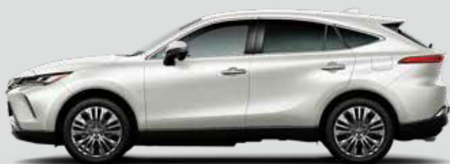
ホワイトパールクリスタルシャイン<070>*1*2