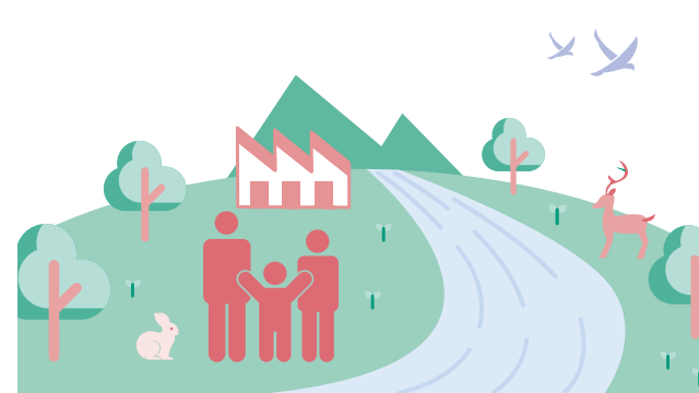
トヨタ MIRAI 環境仕様

トヨタは、水使用による環境負荷を小さくするとともに、生物の多様性を取り戻すために、自然保全活動の輪を地域・世界とつなぎ、そして未来へつなぐ活動を進めます。