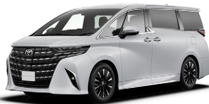
プラチナホワイトパールマイカ(089)*1