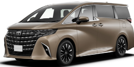
プレシャスレオプロンド(4Y7)*2