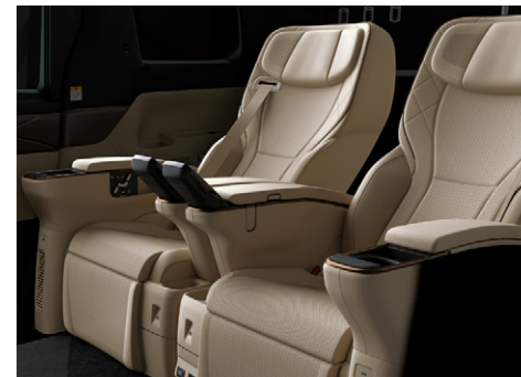
ニュートラルベージュ