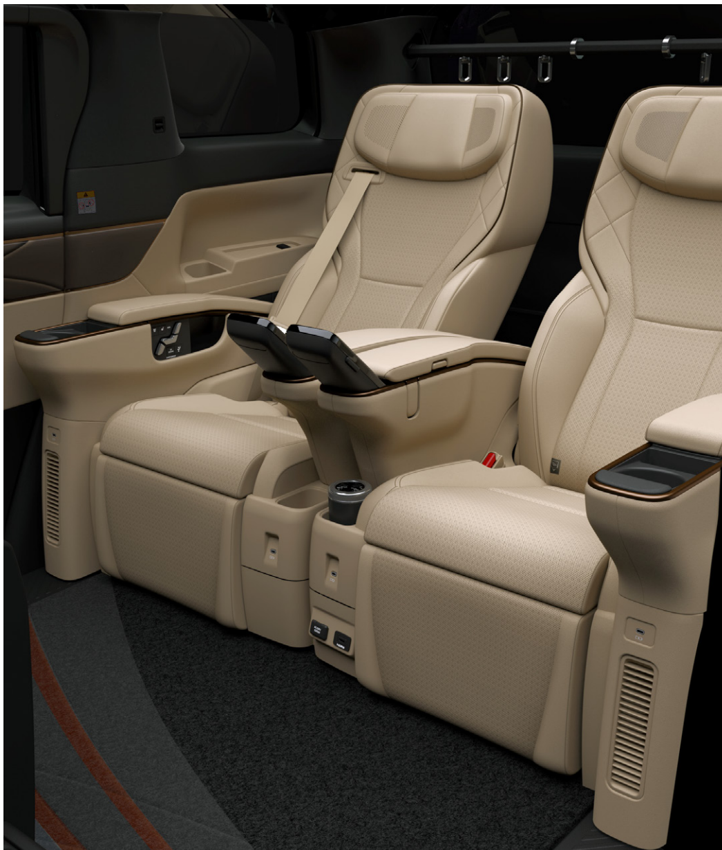
Photo: Spacious Lounge (ハイブリッド・E-Four) の室内。内装色のニュートラルベージュは設定色 (ご注文時に指定が必要です。指定がない場合はブラックになります)。