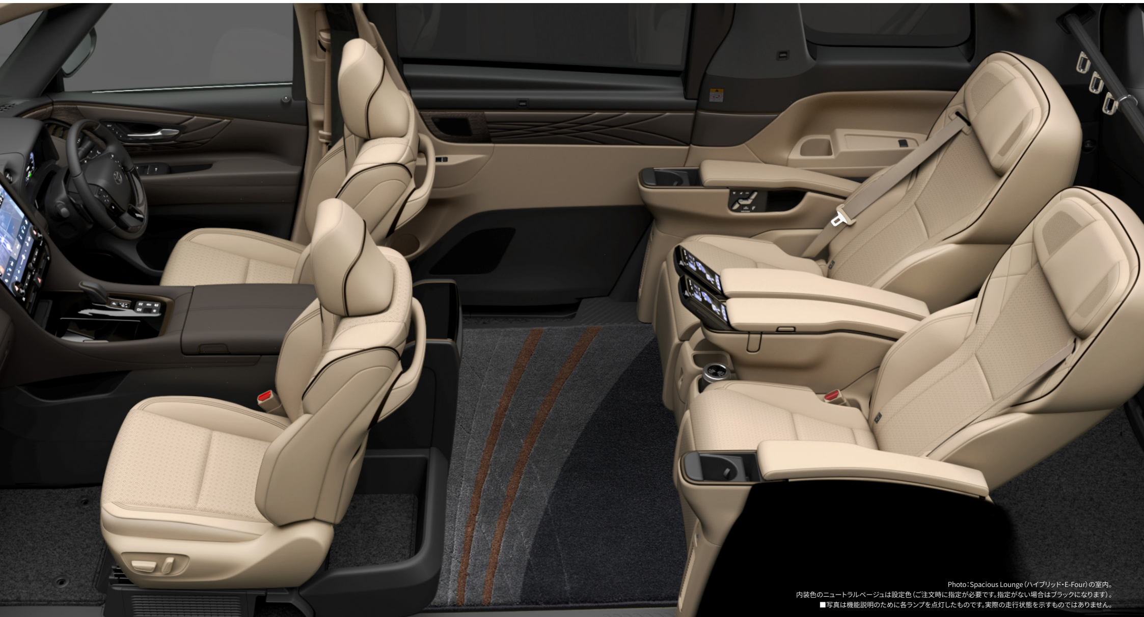
Photo: Spacious Lounge (ハイブリッド・E-Four)の室内。 内装色のニュートラルベージュは設定色(ご注文時に指定が必要です。指定がない場合はブラックになります)。 ■写真は機能説明のために各ランプを点灯したものです。実際の走行状態を示すものではありません。

包まれる。癒される。満たされる。 ここにアルファード史上、最上クラスのラグジュアリー。