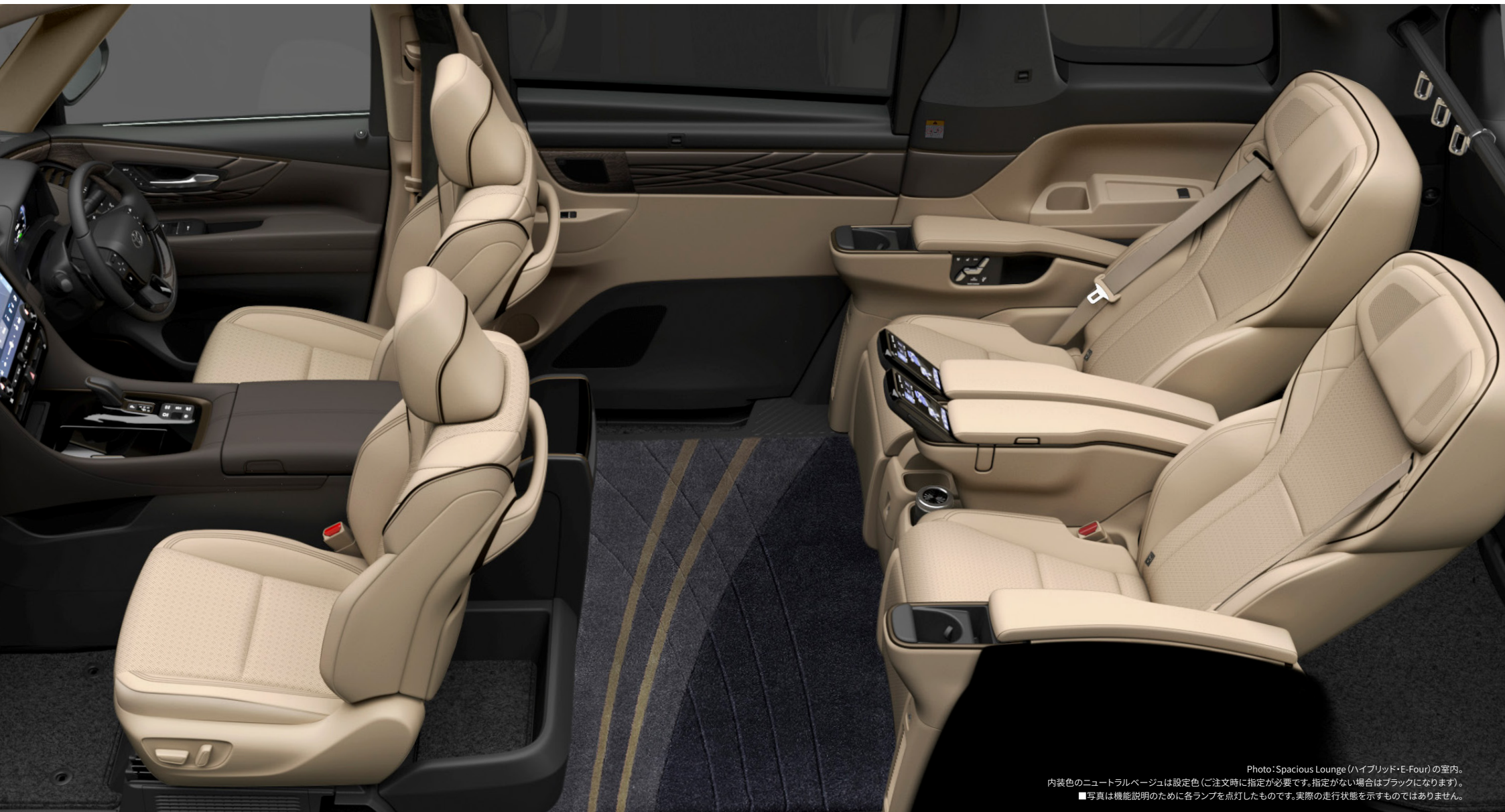
Photo: Spacious Lounge (ハイブリッド・E-Four) の室内。 内装色のニュートラルベージュは設定色 (ご注文時に指定が必要です。指定がない場合はブラックになります)。 ■写真は機能説明のために各ランプを点灯したものです。実際の走行状態を示すものではありません。

包まれる。癒される。満たされる。 ここにアルファード史上、最上クラスのラグジュアリー。