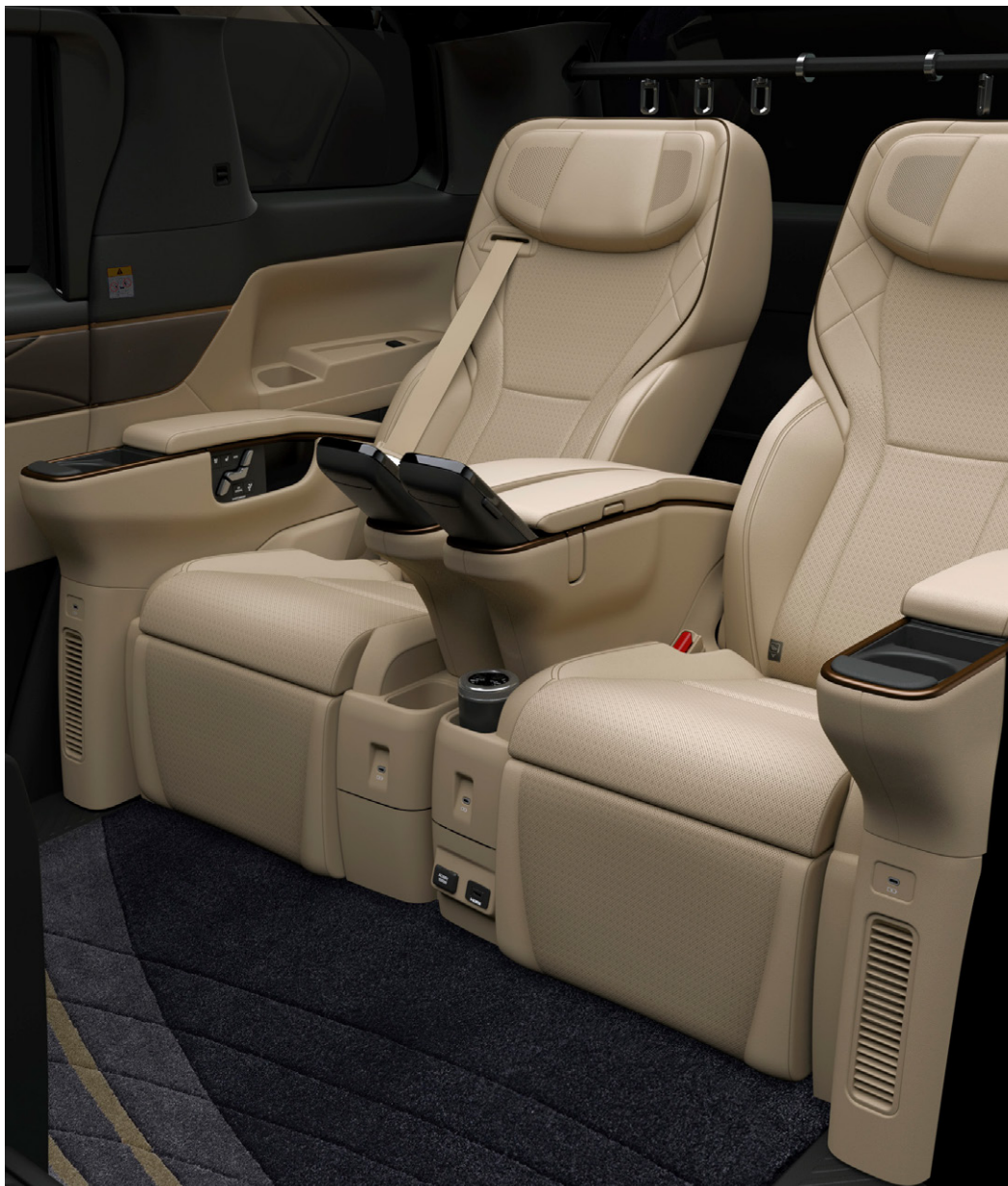
Photo: Spacious Lounge (ハイブリッド・E-Four) の室内。内装色のニュートラルベージュは設定色(ご注文時に指定が必要です。指定がない場合はブラックになります)。