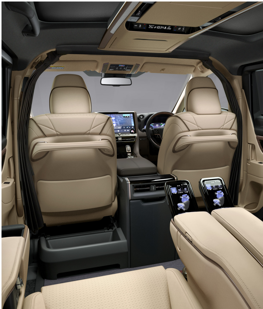
Photo: Spacious Lounge (ハイブリッド・E-Four) の室内。内装色のニュートラルベージュは設定色(ご注文時に指定が必要です。指定がない場合はブラックになります)。

手荷物などを置けるトレイ。縦長の鞆などを置いても倒れにくい、大型の収納スペースになっています。