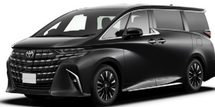
ニュートラルブラック(229)