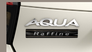
▶ バックドアエンブレム