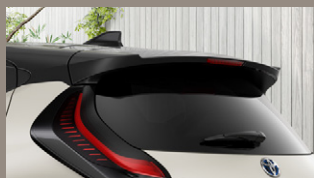
▶ リヤルーフスポイラー (ルーフカラー共通色)