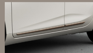
▶ サイドガーニッシュ (ブロンズメタリック塗装)