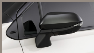
▶ LEDサイドターンランプ付オート電動格納式リモコンカラードアミラー (ヒーター付/ルーフカラー共通色)