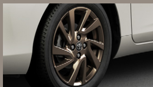
▶ 195/55R16タイヤ&16×6Jアルミホイール (ブロンズ/センターオーナメント付) [2WD]