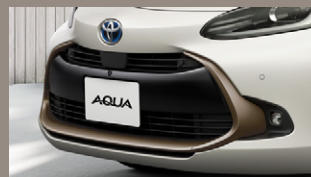
▶ グリルモール (ブロンズメタリック塗装)