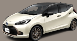
ダークグレー<1L7>×クリアベージュメタリック<4Y3> [2WT]