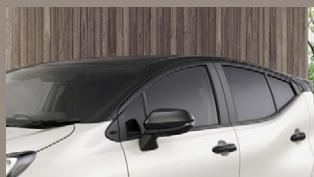
▶ ツートーンルーフ