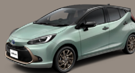
ダークグレー<1L7>×アーバンカーキ<6X3> [2WU]