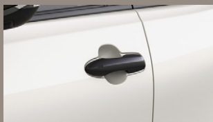
▶ カラードアウトサイドドアハンドル (ルーフカラー共通色)