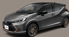
ブラックマイカ<209>×ダークグレー<1L7> [M54] [特別設定色]

Photo: 特別仕様車 Z "Raffine" (2WD) [ベース車両はZ (2WD)]。■ボディカラーおよび内装色は撮影の条件や、ご覧になる印刷物または画面で実際の色とは異なって見えることがあります。また、実車においてもご覧になる環境 (屋内外、光の角度等) により、ボディカラーの見え方は異なります。