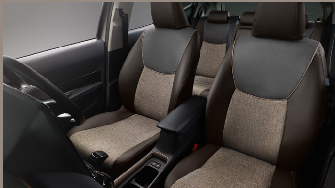
Photo: 特別仕様車 Z "Raffine" (2WD) [ベース車両はZ (2WD)]。ボディカラーはダークグレー<1L7>×クリアベージュメタリック<4Y3> [2WT]。トヨタ チームメイト [アドバンストパーク] + パーキングサポートブレーキ (周囲静止物) とカラーヘッドアップディスプレイはセット<86,900円>でメーカーオプション。合成皮革+コンフォートパッケージ (シート表皮は合成皮革+ストライプ柄ファブリックとなり、フロントコンソール、アッパーボックス、ドアトリムについての内装色は、ブラックとなります) <66,000円>はメーカーパッケージオプション。シートカバー (特別仕様車用) <68,200円 (取付費が別途必要)>、インテリアパネルエンブレム<4,950円 (取付費が別途必要)>、フロアマット (特別仕様車用) <28,050円>、プロジェクションイルミネーション (特別仕様車用) <22,000円 (取付費が別途必要)>、サイドガーニッシュ (ブロンズメタリック塗装) <36,300円 (取付費が別途必要)>、バックドアエンブレム<4,950円 (取付費が別途必要)>は販売店装着オプション。■写真は機能説明のために各ランプを点灯したものです。実際の走行状態を示すものではありません。■画面はハメ込み合成です。