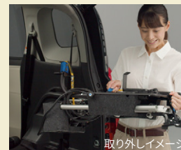
取り外しイメージ

*2 全高は車いすの手押しハンドルをたたんだ状態の寸法です。 *3 全長は車いすの手押しハンドルと転倒防止バーをたたんだ状態の寸法です。 *4 角度の中に車いすが入っている場合、車いすをセットするときに地面にあたるおそれがあります。