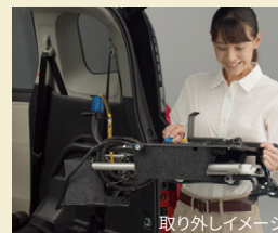
取り外しイメージ