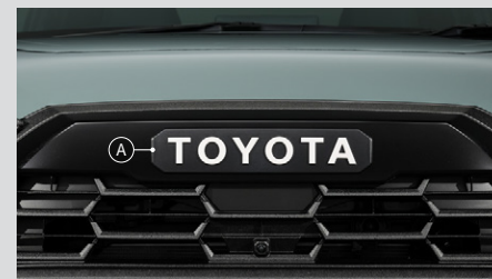
① TOYOTAロゴフロントエンブレム

TOYOTAエンブレムや、メテオコートを施したパーツをフロント、サイド、リヤに配することで、エクステリアに一体感をもたらし、オフロードな佇まいをさらに引き立てます。