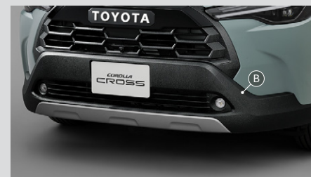
③ フロントロアバンパー(メテオコート)