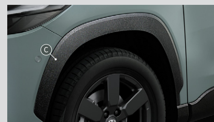
⑤ アーチモール(フロント/リヤ・メテオコート)