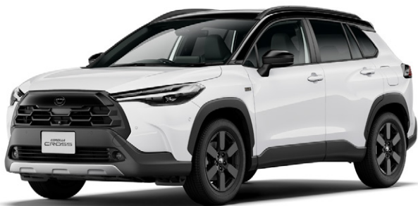
ブラック〈202〉×プラチナホワイトパールマイカ〈089〉[2VP] [特別設定色] *1