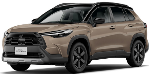
ブラック〈202〉×マッドバス〈4Z2〉[M16] [特別設定色] *2