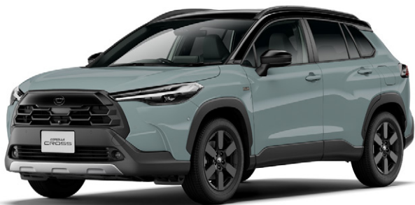
ブラック〈202〉×アーバンカーキ〈6X3〉[M21] [特別設定色] *2

■写真は特別仕様車 Z“Adventure” (2WD) [ベース車両はZ (2WD)]。