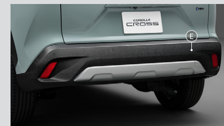
④ リヤロアバンパー(メテオコート)