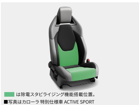
■は除電スタビライジング機能搭載位置。