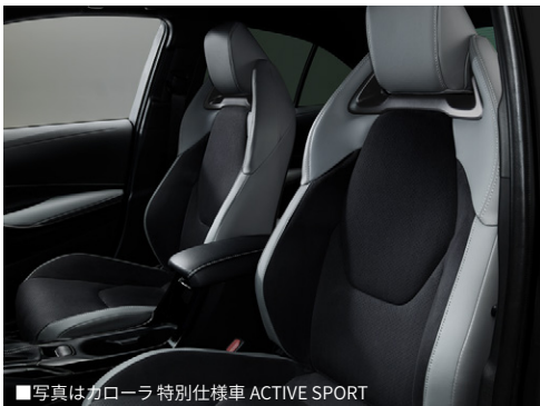
■写真はカローラ 特別仕様車 ACTIVE SPORT