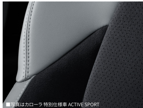
■写真はカローラ 特別仕様車 ACTIVE SPORT

耐久性に優れ、軽量で見た目も美しいアルミ素材を採用。スポーティな気分を味わいながら、スムーズで快適な走りを楽しめます。