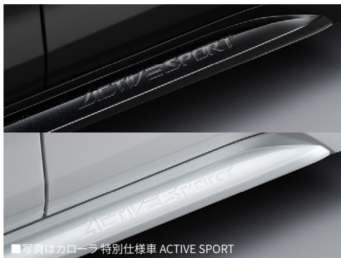
■写真はカローラ 特別仕様車 ACTIVE SPORT

0.0Hは標準取付時間です。作業時間に応じた取付費が別途必要となります。価格は取付費を含まないメーカー希望小売価格<(消費税10%込み) '26年5月現在のもの>で参考価格です。価格、取付費は販売店が独自に定めておりますので、詳しくは各販売店におたずねください。