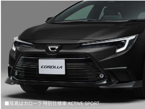
■写真はカローラ 特別仕様車 ACTIVE SPORT