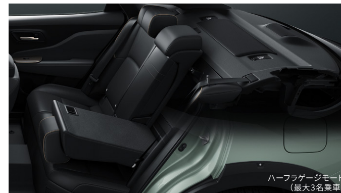
ハーフラゲージモード (最大3名乗車)