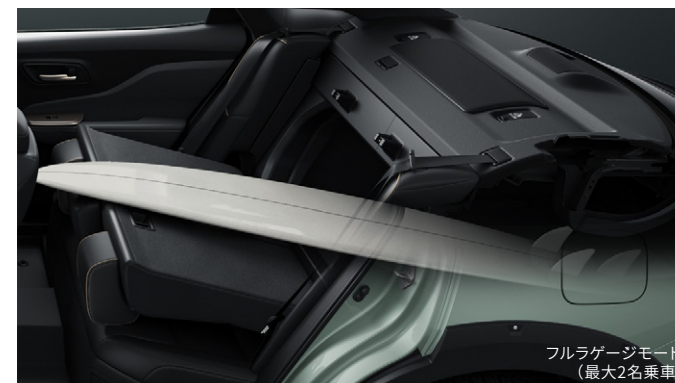
フルラゲージモード (最大2名乗車)