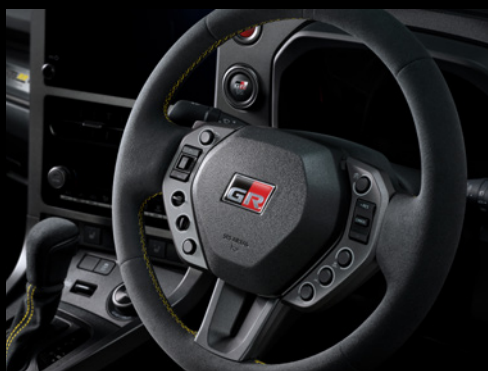
▶ GRステアリングホイール (ウルトラスエード®・イエローステッチ付)

小径化を図り、ステアリングスイッチの配置も一新したGRステアリングホイールなど、随所にウルトラスエード®を採用。イエローのステッチもあしらって個性的な室内空間を創出しています。