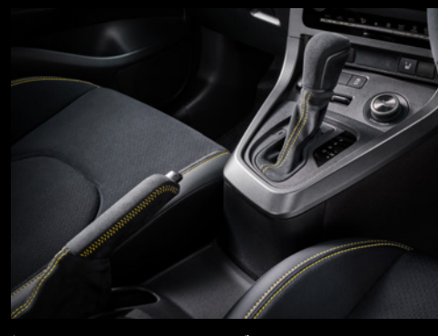
▶ ウルトラスエード®シフトノブ+ウルトラスエード®シフトレバーブーツ(イエローステッチ付)+ウルトラスエード®パーキングブレーキグリップ&カバー(イエローステッチ付)