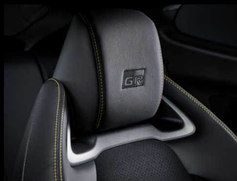
▶ 専用刺繍入りヘッドレスト