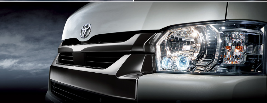
Photo:特別仕様車スーパーGL“DARK PRIME II”(4WD・2700ガソリン・ワイドボディ)[ベース車両はスーパーGL(4WD・2700ガソリン・ワイドボディ)]. ボディカラーのホワイトパールクリスタルシャイン<070>はメーカーオプション。

Photo:特別仕様車スーパーGL“DARK PRIME II”(2WD・2800ディーゼル・標準ボディ)[ベース車両はスーパーGL(2WD・2800ディーゼル・標準ボディ)]. ボディカラーの特別設定色スパークリングブラックパールクリスタルシャイン<220>はメーカーオプション。