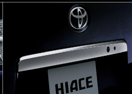
■ メッキバックドアガーニッシュ(ダークメッキ)