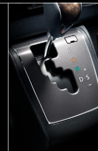
■ シフトベゼル(ダークシルバークロム加飾)