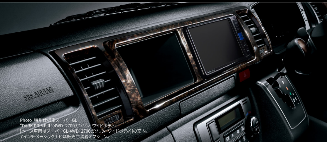
Photo:特別仕様車スーパーGL “DARK PRIME II”(4WD・2700ガソリン・ワイドボディ) [ベース車両はスーパーGL(4WD・2700ガソリン・ワイドボディ)]の室内。 7インチベシックナビは販売店装着オプション。