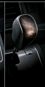
■ シフトノブ(本草+黒木目マホガニー調加飾)