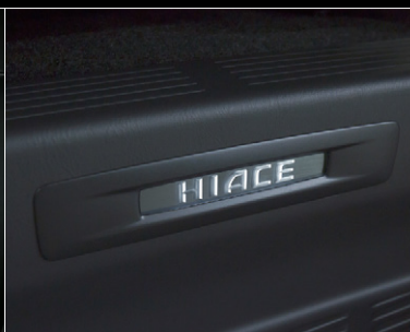
■ スライドアスキャッププレート (車名ロゴ&イルミネーション付)