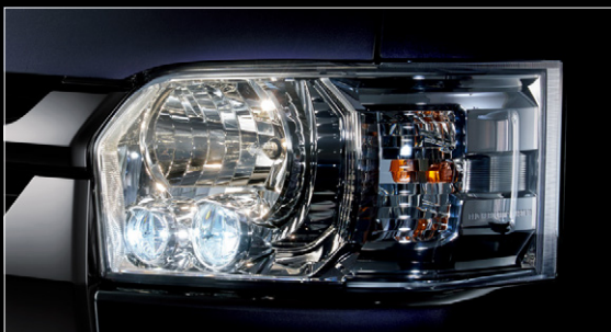
■ LEDヘッドランプ(クリアスモーク加飾)