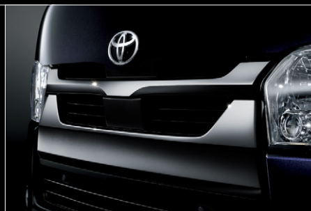
■ メッキフロントグリル(ダークメッキ)