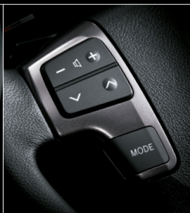
■ ステアリングスイッチベゼル (ダークシルバークロム加飾)