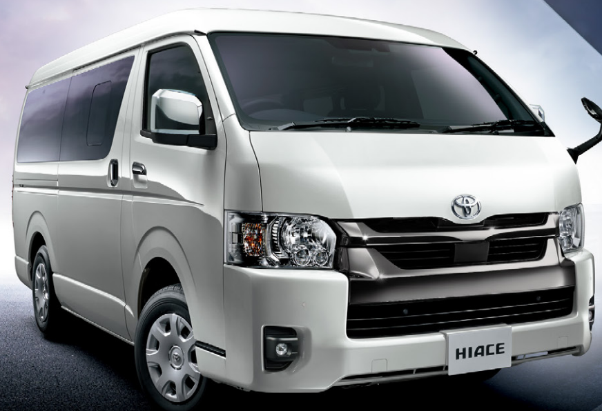
Photo:特別仕様車スーパーGL“DARK PRIME II”(2WD・2800ディーゼル・標準ボディ) [ベース車両はスーパーGL(2WD・2800ディーゼル・標準ボディ)]. ボディカラーの特別設定色スパークリングブラックパールクリスタルシャイン<220>はメーカーオプション。