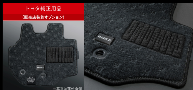
■ フロアマット(特別仕様車専用) 材質:ポリプロピレン 色:ダークグレー 1台分 28,600円 (消費税抜き 26,000円) <A0GD>