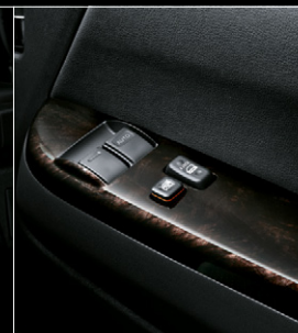
■ フロントドアトリム(合成皮革) ■ パワーウィンドウスイッチベース (黒木目マホガニー調加飾)