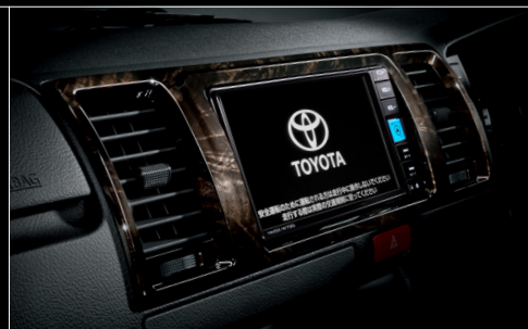
■ インstrumentパネルアッパー部(黒木目マホガニー調加飾) ※写真の7インチベジックナビは販売店装着オプション。