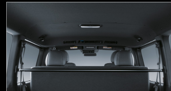
■ ルーフ&ピラー(ブラック)