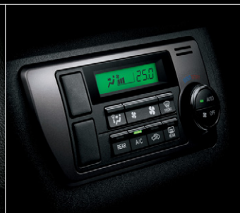
■ フロントエアコンプッシュ式コントロールパネル (ダークシルバークロム加飾)