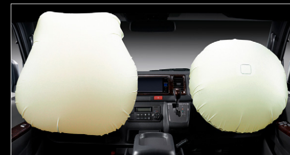
■ SRS*エアバッグ+プリテンショナー&フォースリミッター機構付シートベルト(助手席)