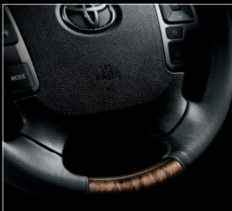
■ 4本スポークステアリングホイール (本草巻き+黒木目マホガニー調加飾)