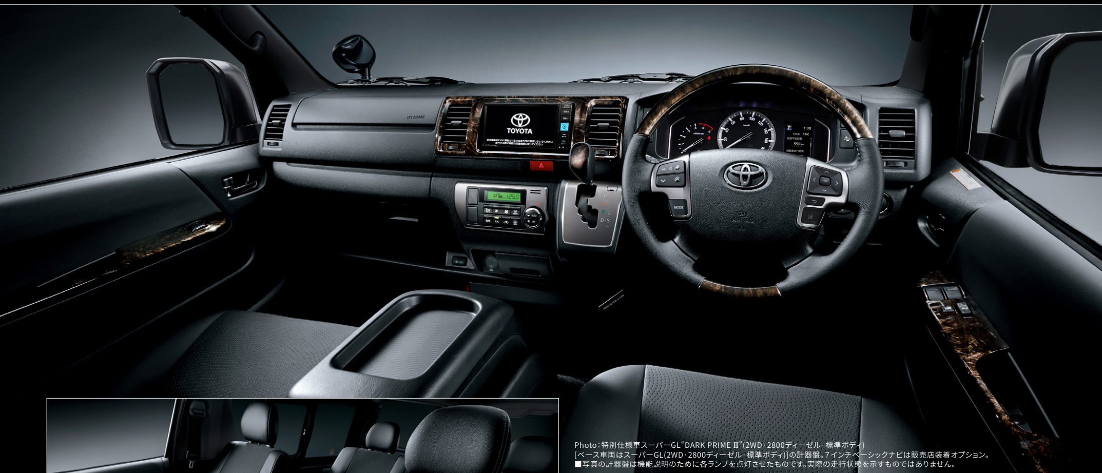
Photo: 特別仕様車スーパーGL「DARK PRIME II」(2WD・2800ディーゼル・標準ボディ) [ベース車両はスーパーGL(2WD・2800ディーゼル・標準ボディ)]の計器盤。7インチペーシクナビは販売店装着オプション。 ■写真の計器盤は機能説明のために各ランプを点灯させたものです。実際の走行状態を示すものではありません。