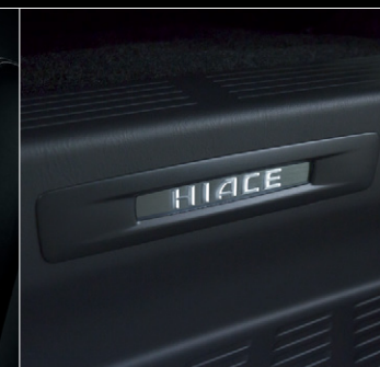
■ スライドドアスカッププレート (車名ロゴ&イルミネーション付)