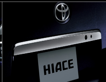
■ メッキバックドアガーニッシュ (ダークメッキ)