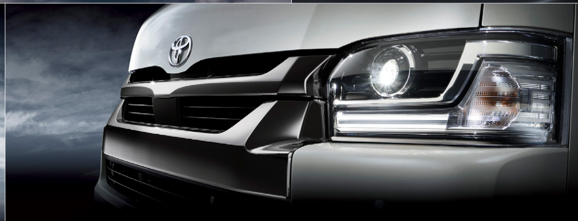
Photo:特別仕様車スーパーGL“DARK PRIME II”(4WD・2700ガソリン・ワイドボディ)[ベース車両はスーパーGL(4WD・2700ガソリン・ワイドボディ)]。 ボディカラーのプラチナホワイトパールマイカ<089>はメーカーオプション。