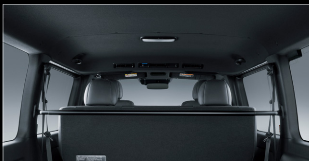
■ ルーフ&ピラー (ブラック)