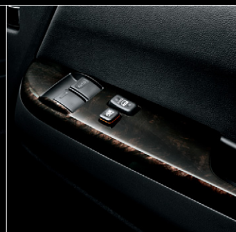
■ フロントドアトリム (合成皮革) ■ パワーウィンドウスイッチベース (黒木目マホガニー調加飾)