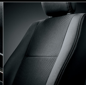
■ シート表皮:トリコット+ 合成皮革&ダブルステッチ