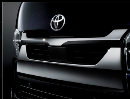
■ メッキフロントグリル (ダークメッキ)