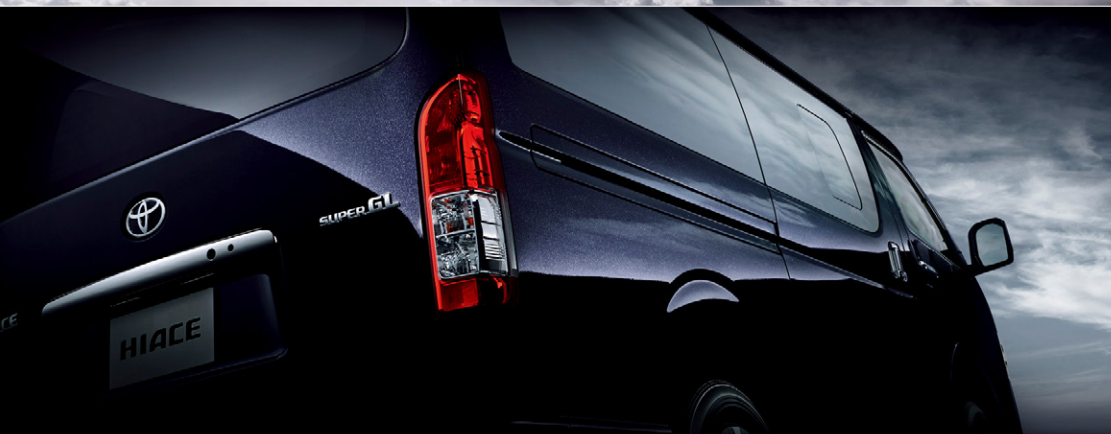
Photo:特別仕様車スーパーGL“DARK PRIME II”(2WD・2800ディーゼル・標準ボディ)[ベース車両はスーパーGL(2WD・2800ディーゼル・標準ボディ)]。 ボディカラーの特別設定色スパークリングブラックパールクリスタルシャイン<220>はメーカーオプション。