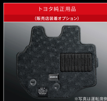
トヨタ純正用品 (販売店装着オプション)