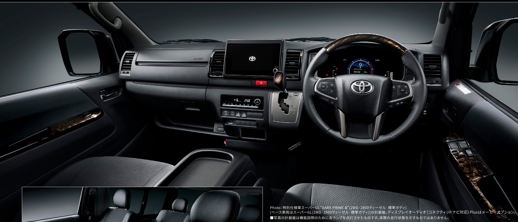
Photo:特別仕様車スーパーGL“DARK PRIME II”(2WD・2800ディーゼル・標準ボディ) [ベース車両はスーパーGL(2WD・2800ディーゼル・標準ボディ)]の計器盤。ディスプレイオーディオ(コネクティッドナビ対応)Plusはメーカーオプション。 ■写真の計器盤は機能説明のために各ランプを点灯させたものです。実際の走行状態を示すものではありません。