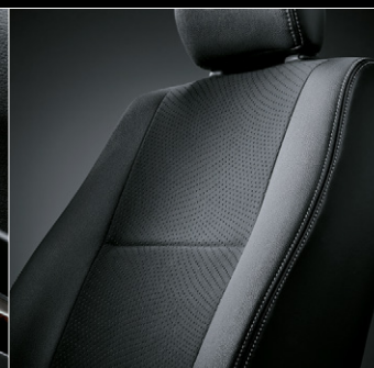
■ シート表皮:トリコット+ 合成皮革&ダブルステッチ