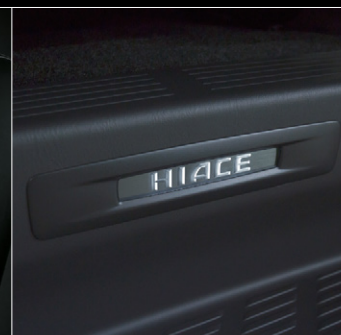
■ スライドドアスカッププレート (車名ロゴ&イルミネーション付)