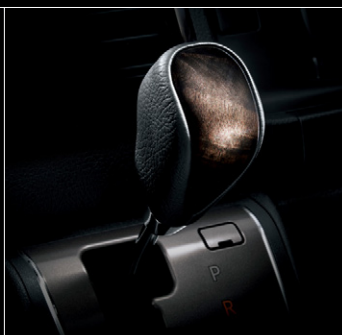
■ シフトノブ (本革+黒木目マホガニー調加飾)