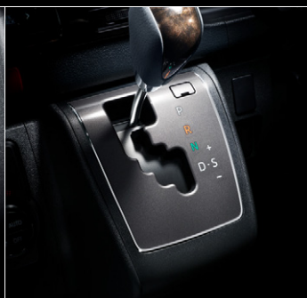
■ シフトベゼル (ダークシルバー加飾)