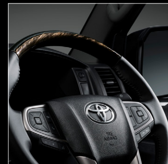
■ 3本スポークステアリングホイール (本革巻き+黒木目マホガニー調加飾)