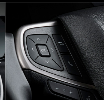
■ ステアリングスイッチベゼル (ダークシルバー加飾)