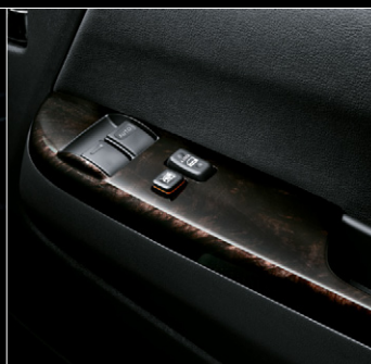
■ フロントドアトリム(合成皮革) ■ パワーウィンドウスイッチベース (黒木目マホガニー調加飾)