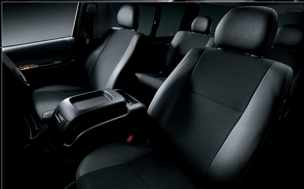
Photo:特別仕様車スーパーGL“DARK PRIME II”(2WD・2800ディーゼル・標準ボディ)[ベース車両はスーパーGL(2WD・2800ディーゼル・標準ボディ)]の室内。