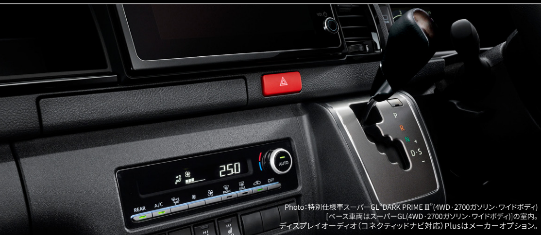
Photo:特別仕様車スーパーGL“DARK PRIME II”(4WD・2700ガソリン・ワイドボディ) [ベース車両はスーパーGL(4WD・2700ガソリン・ワイドボディ)]の室内。 ディスプレイオーディオ(コネクティッドナビ対応)Plusはメーカーオプション。