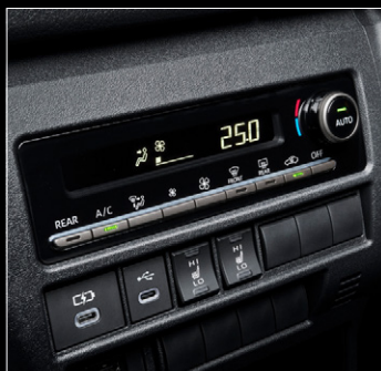
■ フロントエアコンプッシュ式 コントロールパネル (ダークシルバー加飾)