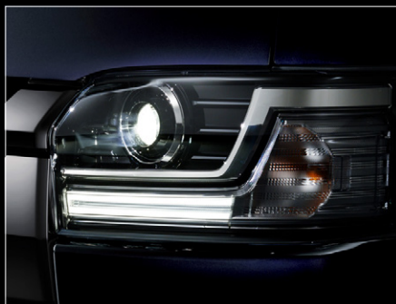
■ Bi-Beam LEDヘッドランプ