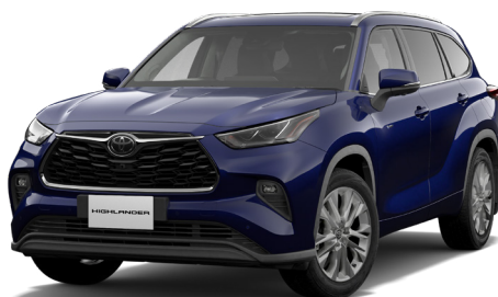
ダークブルーマイカ<8X8>