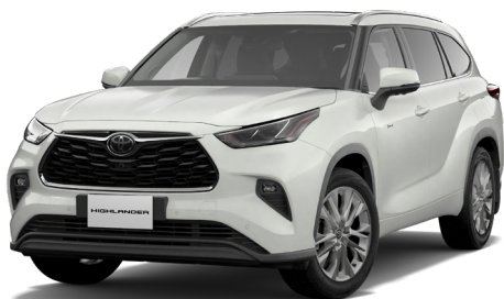
プラチナホワイトパールマイカ<089>*1