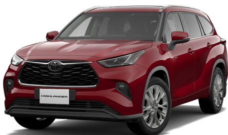
センシユアルレッドマイカ<3T3>*1