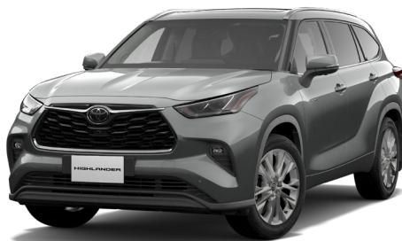
プレシャスメタル<1L5>*2