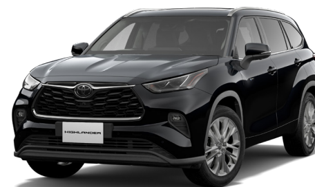
アディチュードブラックマイカ<218>