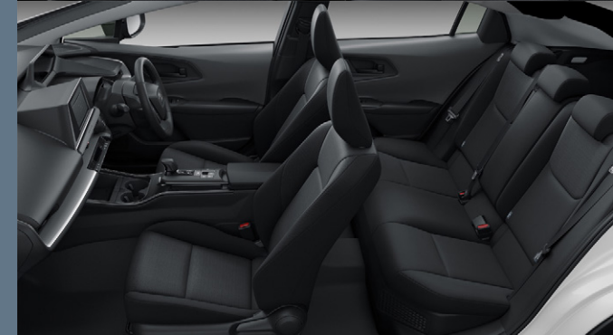
Photo: X (2WD)。ボディカラーはスーパーホワイトII (040)。内装色はアクティブグレー。オーディオレスカバー<1,320円(取付費が別途必要)>は販売店装着オプション。 ■写真は合成です。 ■写真は機能説明のために各ランプを点灯したものです。実際の走行状態を示すものではありません。 ■写真は機能説明のためにボディの一部を切断したカットモデルです。